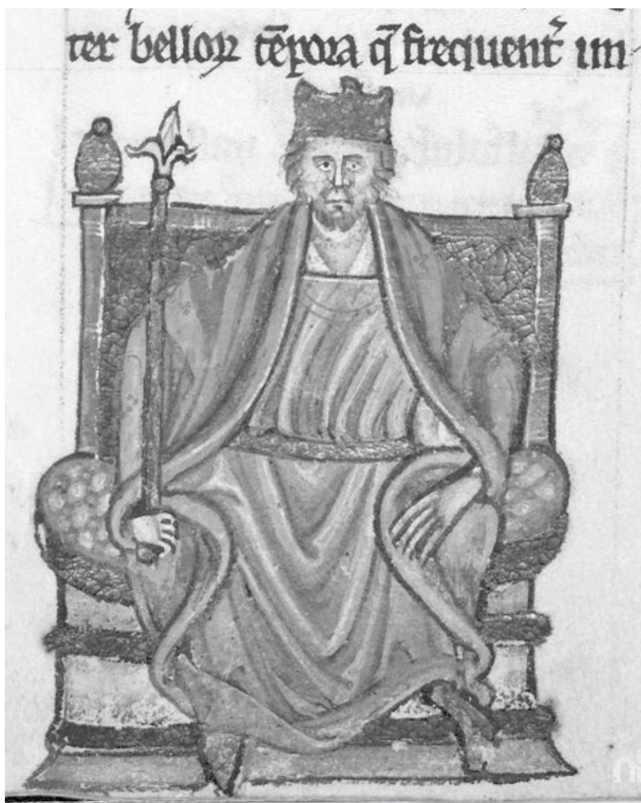
II. Henrik ( Topographia Hibernica , ca. 1186–1188)