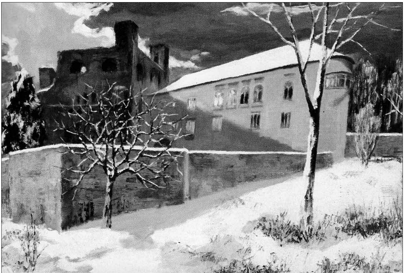
A pataki vár

A Wass Albert Könyvtár és Múzeum honlapja : http://www.vktapolca.hu/cgi-bin/tlwww.cgi?show=da197277