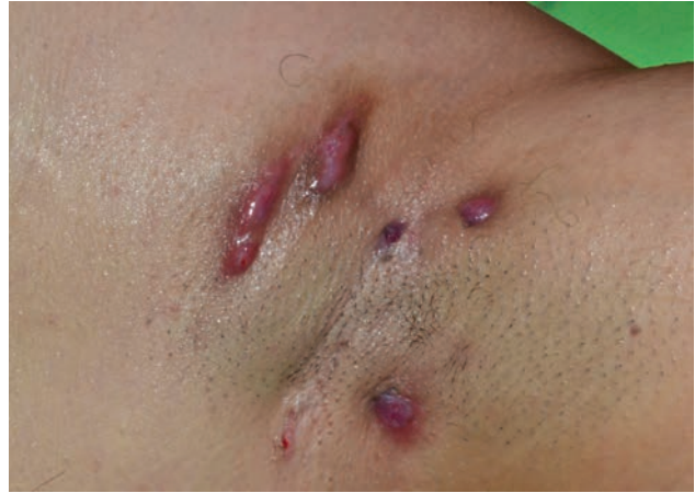
2. ábra Hurley I. stádium axillaris lokalizációban egy 38 éves nőbetegen

A HS súlyosság szerinti besorolásánál a Hurley és a Sartorius-skálát alkalmazzák leggyakrabban. A gyakorlatban az egyszerűbb Hurley-besorolás jobban elterjedt (22). A Hurley I. stádiumra jellemző a tályogképződés sipolyjáratok és hegesedés nélkül (2. ábra). A tályogok egy adott régióban egyszeres vagy többszörös formában jelentkeznek. A mérsékelt II. stádiumra jellemző a visszatérő tályogképződés, sipolyok kialakulása és hegesedés. A léziók szoliter formában vagy többszörösen, de egymástól jól elkülönülten jelentkeznek egy adott régióban (3. ábra). A súlyos III. stádiumra jellemző az adott régióban kialakult diffúz vagy csaknem diffúz érintettség, többszörösen összekapcsolódó járatokkal és tályogokkal, kiterjedt hegesedéssel (4., 5. ábra). Az enyhe Hurley I. stádium teszi ki az esetek nagy részét, mintegy 68 %-át, a mérsékelt Hurley II. stádium 28%-ban, az igen súlyos III. stádium 4%-ban észlelhető. A Sartorius-skála a betegség súlyosságának dinamikusabb megítélésre szolgál. Fő paramétere az egyedi nodulusok és fisztulák száma, azon-