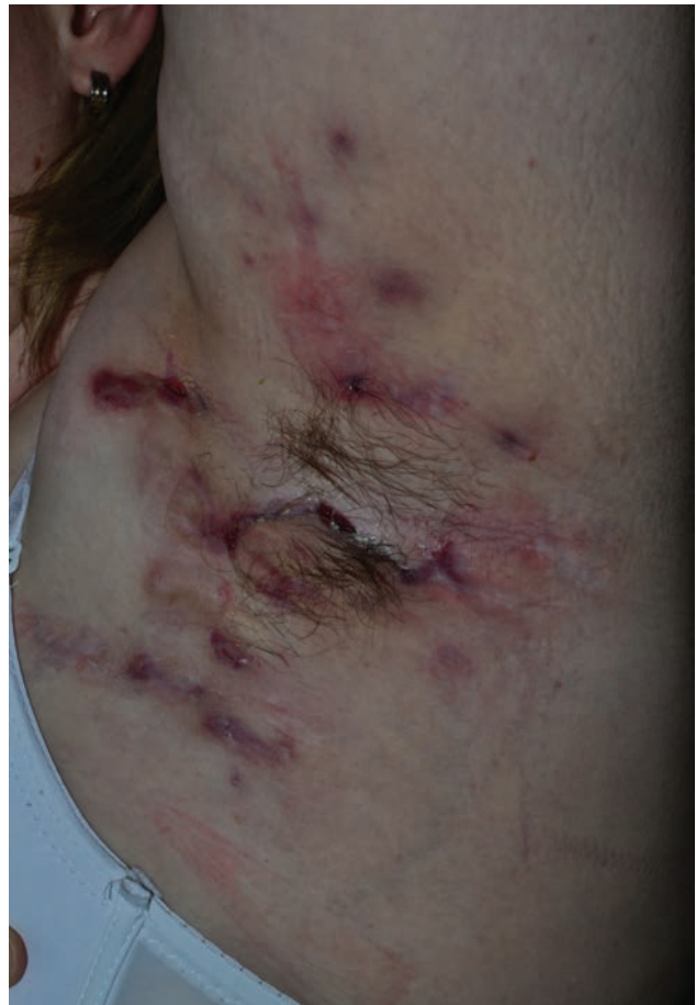
3. ábra Hurley II. stádium kiterjedt axillaris érintettséggel, de kifejezett hegesedés nélkül egy 28 éves nőbetegen

ban számos olyan tényezőt is figyelembe vesz, amelyet a terápia nem befolyásol (23,24). Összességében mindkét klasszifikációról elmondható, hogy elsősorban a betegség statikus jellemzőit veszi figyelembe, emiatt kevésbé alkalmas a terápiás beavatkozások hatásosságának követésére a klinikai gyakorlatban.