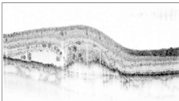
1. ábra. Az automatikus HRD detektor eredménye.

A neuronháló által végzett HRD detektálás egy eredményét az 1. ábra szemlélteti.