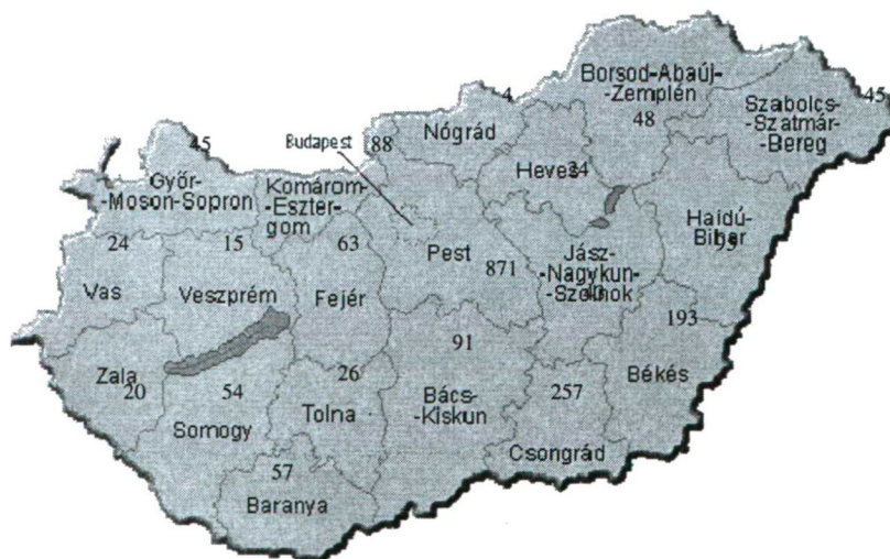
3. ábra. A belföldi vendégforgalom összetétele a vizsgált időszakban (2001-2005) megyék szerint (fő)