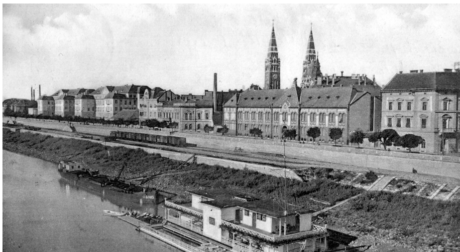
Tiszaparti részlet / The bank of river Tisza