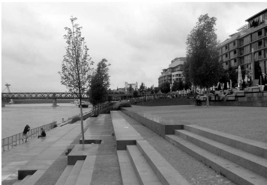
Az új folyópart / The new embankment