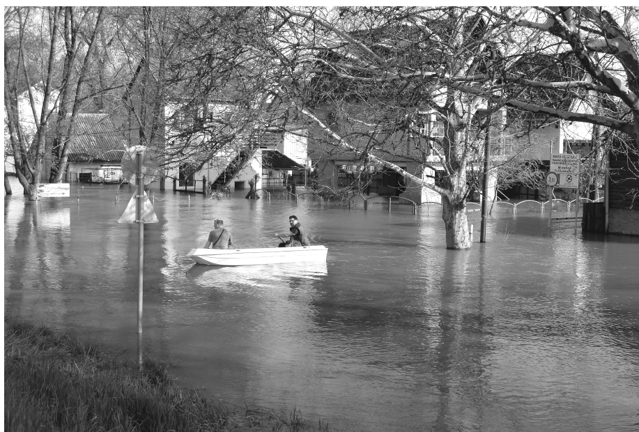
Áradás az üdülőtelepen / Flood in the summer cottage area (Fotó / Photo: Mód László, 2010)