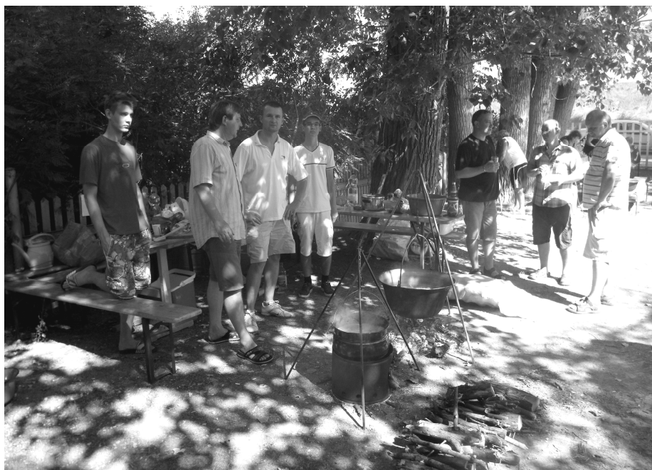
Versenyzők a Szent István Népiünnepélyen / Competitors on the feast of Saint Stephen