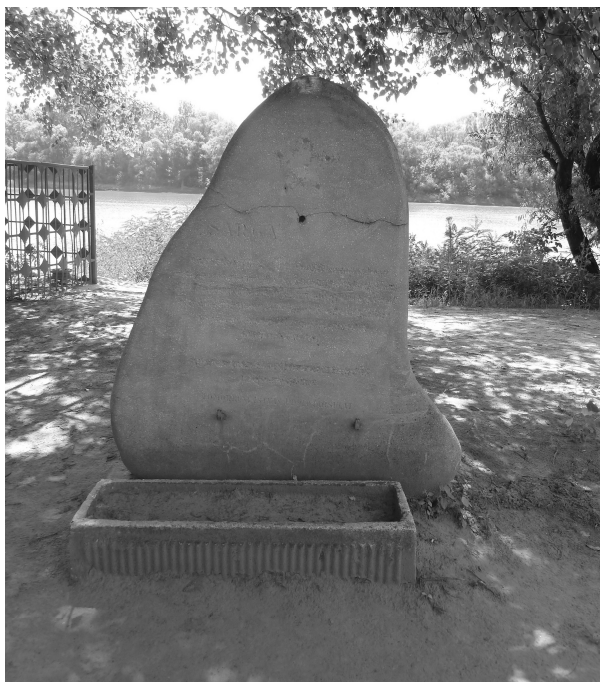
Az emlékmű 2013-ban / The monument in 2013