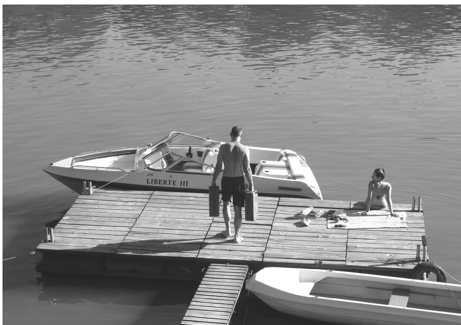
Móló motorcsónakkal / Jetty with a motor-boat