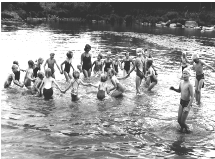
Úszó iskola az Aura folyóban / Swimming school in River Aura