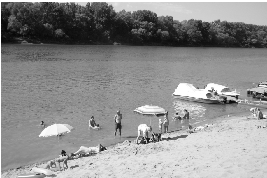
Az üdülőtelep strandja / The beach of the summer cottage area