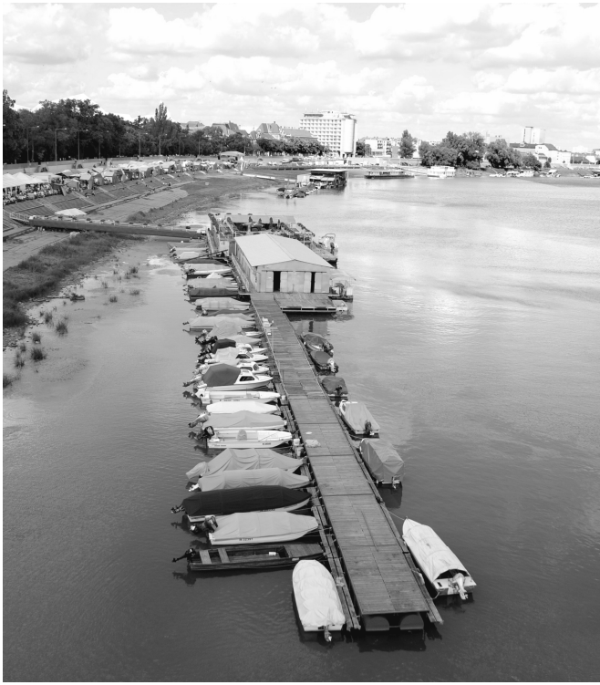
Úszóház a Tiszán 2015-ben / Floating-house on the Tisza nowadays.