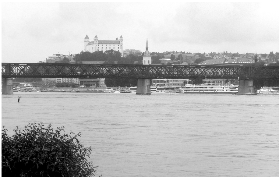
A régi híd és a vár / The old bridge and the castle