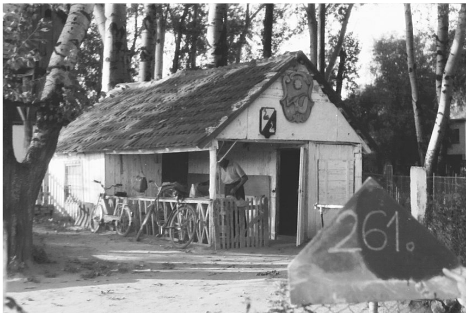
Nyáraló az 1970-es években / Summer cottage in the 1970's