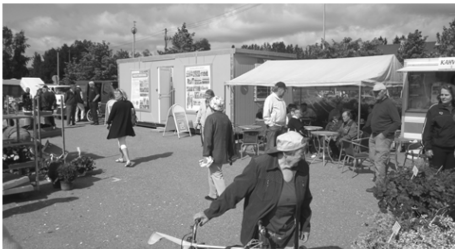
A „Sárga emlékszoba” Kyrö piacterén / Yellow "Memory room" (Muistihuone in Finnish) at Kyrö market place