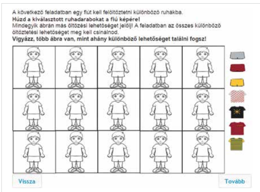
15.3. ábra. Példafeladat a Descartes-féle szorzatok képzésére képi tartalom

illetve kattintással lehetett létrehozni a különböző összeállításokat. A 15.3. ábra a Descartes-féle szorzatok képzéséhez tartozó online feladatot mutatja be. Ezt a feladattípust (ruhadarabokból készített összeállítások) több kutató is alkalmazta már, például English (1991) négyéves gyermekek vizsgálatára is alkalmasnak találta. Az eredeti, papíralapú feladatban minden egyes kis képen szerepeltek a felhasználható ruhadarabok, és a megfelelő ruhadaraboktól egy kis vonalat kellett húzni a felhasználás helyére. A számítógépes megvalósításnál csak egy helyen szerepel a felhasználható ruhakészlet, és az egerrel a helyére lehet húzni a megfelelő színű ruhadarabokat, természetesen mindegyikből bármennyit fel lehet használni. A részletgazdagabb színes képek és a mozgatás lehetősége eleve érdekesebbé teszi a feladatot, és az elkészült konstrukciókban is könnyebb az azonosságok/különbségek felismerése. Ezek az apró változtatások is autentikusabbá teszik a feladatot. Ugyanakkor a papíron megvalósított képi feladatokhoz viszonyítva itt is elmozdul a feladatmegoldás a manipulatív jelleg felé, mivel itt is objektumokat kell mozgatni.