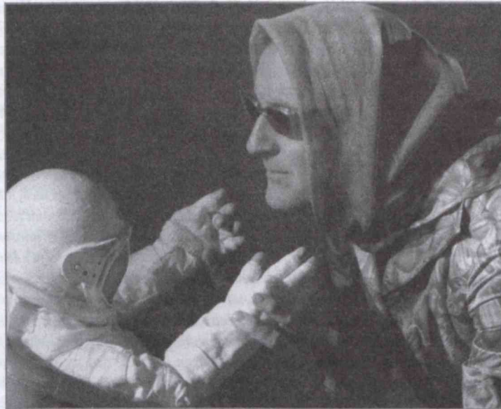
LEPAGE: A HOLD ELREJTETT ARCA

fontosak az emlékek, a száműzetés élménye: Mouawad esetében ezeket még kiegészíti a háború, ami szülőföldjét évtizedek óta sújtja. Legújabb darabja, az Incendies (Tüzek), amelyen francia társulattal majd egy éven át dolgozott - ősbemutatója is Európában volt - görög