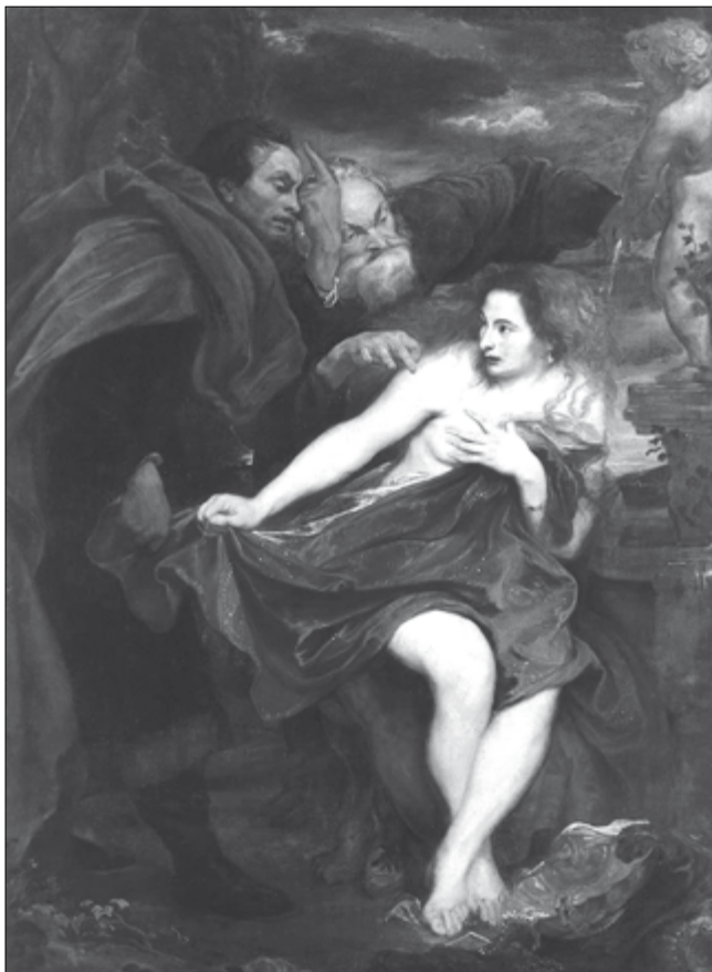
Anthony van Dyck: A fűrdőző Zsuzsanna 11

A nászi és az áv bet din előtt ülő bírác sorrendben elmondták a véleményüket, érveiket a szóban forgó eset minden körülményére nézve. Először a legfiatalabb és a tapasztalatlanabb bírác mondták el véleményüket, hogy az állásfoglalásukat ne befolyásolja az előkelőbbek véleménye. Mindegyik bírác köteles volt alapos megfontolás alapján és lelkiismerete szerint saját véleményt alkotni, függetlenül a többi bírác álláspontjától. Ha valamelyikük nem hozott önálló ítéletet, hanem másnak a véleményé-