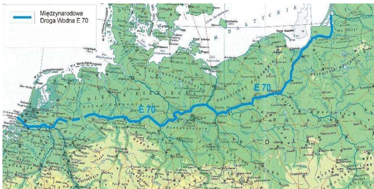
3. ábra: Az E-70-es vízi útvonal elhelyezkedése