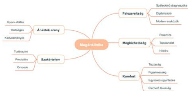
2. ábra: Összesített asszociációs térkép Figure 2. Aggregated association map.

Ennél a lépésnél a szófelhő és más hálózati vizualizációs technika is jól alkalmazható lenne. Jelen esetben a központi fogalomhoz való kapcsolódást és tágabb asszociációk viszonyrendszerét ábrázoltuk, mind a fenti (első fókuszcsoport saját munkája), mint a lenti összesített asszociációs térkép esetén (mindonmap.com használatával). Nem törekedtünk a távolságok és az ismétlődések, valamint a kapcsolat szorosságának (fenti ábrán vonalvastagság jelzi) bemutatására az egyszerűbb érthetőség érdekében. Az elképzelés szerint először gondolatátérképező eszközöket használhatunk a memetikai térkép vizuális megjelenítéséhez (mindmeister.com). A központi csomópontként az „Egészségügyi intézmények” elemet helyezük el a térkép közepén. Az elágazásokkal az elsődleges és másodlagos asszociációkat, valamint további meghatározott mémeket jelenítjük meg (lásd. 2. számú ábra).