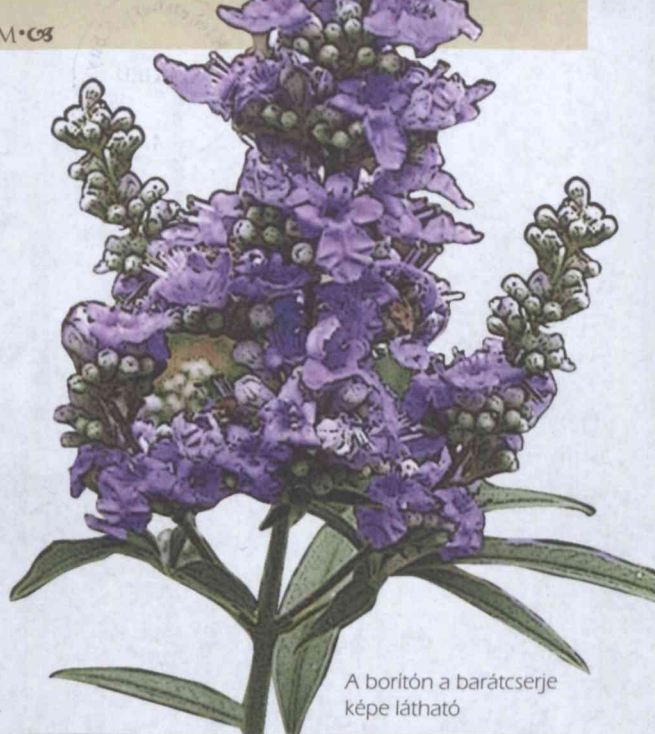
A borítón a barátcserje képe látható