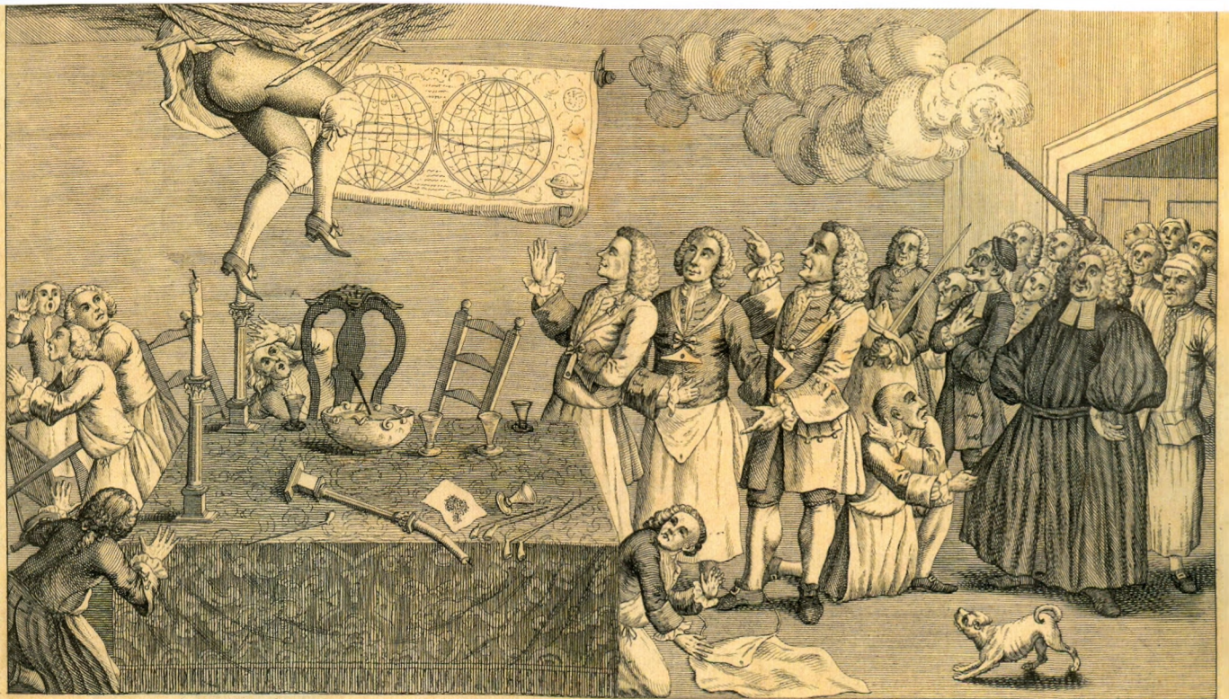
The FREE-MASON'S SURPRIZ'D or the SECRET DISCOVERED A true tale from a Masons Lodge in Canterbury. The Chamber-Maid Moll a Girl who fell happen'd to slip & falling broke out with this white as downy Masons room. Comed all prying & spying she warn'd by 5 the Masons many a man with out touching the lay hid in the Garret as shy as a cat, & hung in y e posture you have in y e View. & call'd up y e persons who look'd & the Town. The subject of this is the Print & the Draw. Tho' some of them Brethren are not M o ncy peop l . To find out y e secret of Masons' below. Which y e fight of Masons' do'ing much to lay y e poor Devil thus penitentiary to get a secret which were can be known. That Profan & Clerks, with their sanctified faces, Which none can tell themselves do not. Who stoutly cry'd out, the D and y e Devil. Whom some of y e old W o ld say y e Temple of y e assembly slip into. Discover'd her own. And a Proprietor Moll's friends just as they sit. Printed for E. Wilkins in Roper's Street and Published according to Act of Parliament &c. 1754.

természetesen a korabeli sztereotípiákra épült: a nők kíváncsisága és alkalmatlansága titkok megtartására.