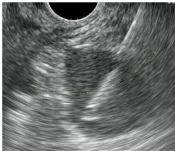
3. ábra | Pararectalis nyirokcsomó ultrahangvezérelt mintavétele

Rectalis ultrahangvizsgálattal a nyirokcsomók megítélése azok morfológiai jellemzői alapján (alak, méret, echogenitás, lebenyezettség, homogenitás stb.) lehetséges. A metasztatikus nyirokcsomók rendszerint echoszegények, éles szélűek, kerekesebbek, és nagyobb fokú lebenyezettséget mutatnak, mint a gyulladásos, reaktív nyirokcsomók. Az áttétes nyirokcsomókra vonatkozó méretbeli kritérium meghatározása nem kevés problémát rejt magában, hiszen nyirokcsomó-megnagyobbodás lehet gyulladás következménye is, másrésztől viszont a normális méretű nyirokcsomók is tartalmazhatnak mikrometasztázisokat. Általában az 5 mm-nél nagyobb átmérőjű képleteket tekintjük patológiás méretűnek, de vannak, akik minden hypodens, kerek képletet nyirok-