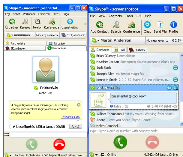
1. ábra: A Skype IM rendszer funkciói

Az azonnali üzenetküldések elküldött szegmenseit a rendszerek percre, vagy másodpercre pontosan mentik, amelyekből több IM-re jellemző diskurzussajátosságra is következtethetünk. Az alábbi ábrán a skype, mint IM rendszer funkcióit láthatjuk.