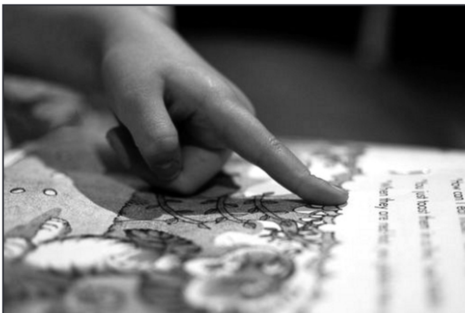
A kis olvasó