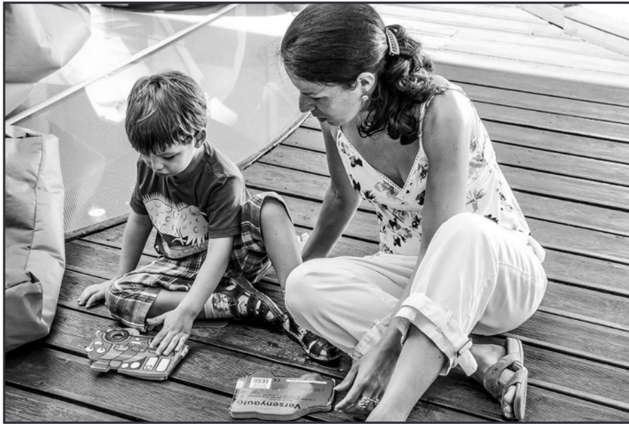
Egy 3,5 éves kislány és anyukája közös könyvnézegetése és beszélgetése a könyvről a Körbirodalom Gyermekkönyvtárban