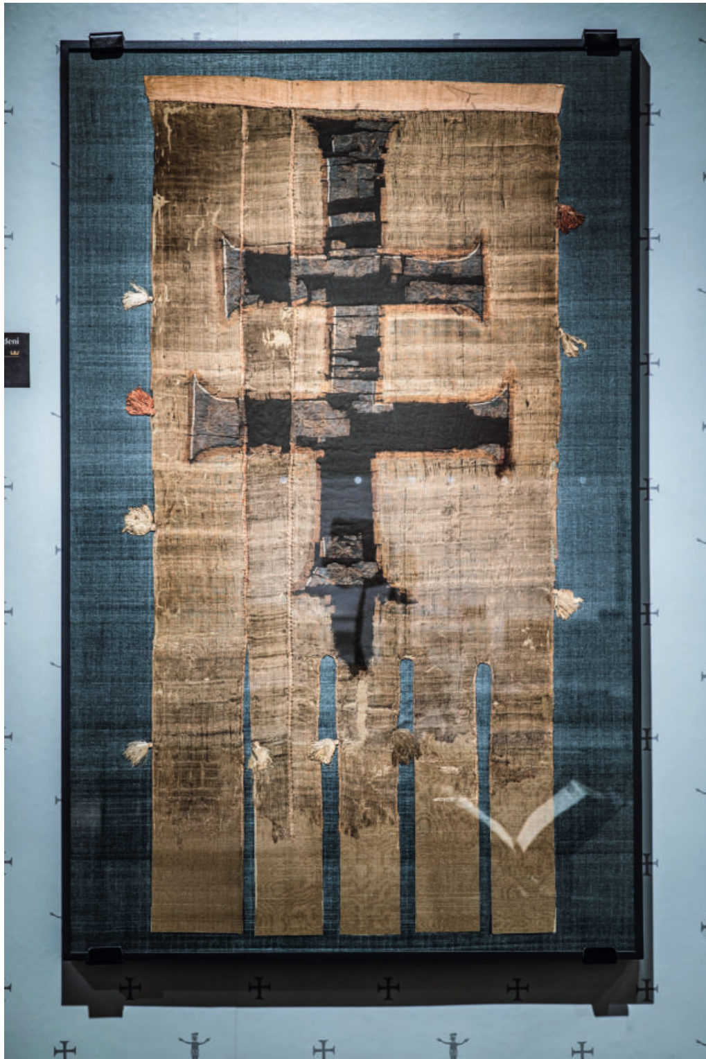
Magyar zászló a königsfeldeni kolostorból, 14. század első fele Bernisches Historisches Museum