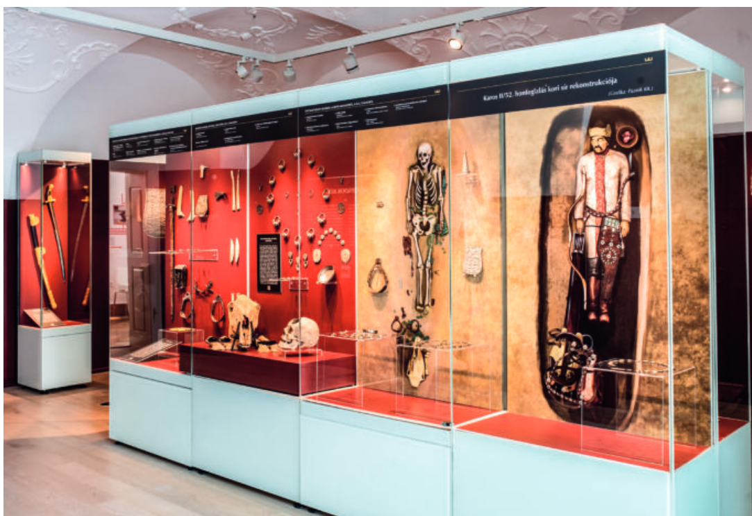
A Királyok és Szentek – Az Árpádok kora kiállítás honfoglalás korát bemutató termének részlete

történészeknek korábbi, ezt kétségbe vonó álláspontjuk 14 újraértékeléséhez. A honfoglalók bronzkorig rekonstruált története segíthet a korábbi nyelvészeti hipotézisek pontosításában is, így például a magyar nyelv iráni jövevényszavai 15 talán a szarmatákhoz köthetők, míg a legkorábbi török jövevényszavak 16 jó eséllyel a hunoknak tulajdoníthatók.