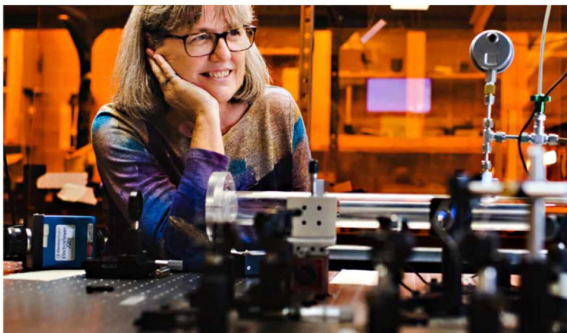
a University of Waterloo Nobel-díjas professzora.

sített rácsos kompresszorral időben összenyomták. Ezzel az eredeti impulzus energiáját 250-szeresre növelték, míg időbeli hosszát egy ps alá vitték (0,7 ps).