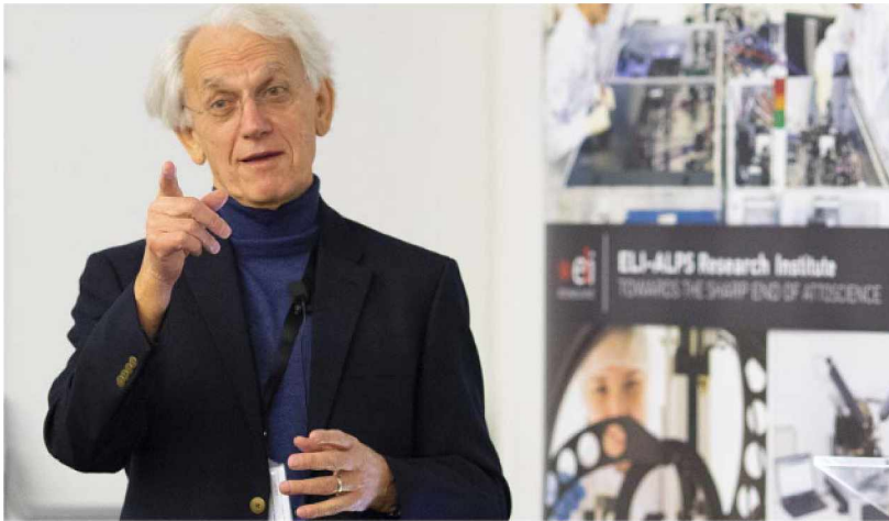
előadást tart 2018. november 14-én a szegedi ELI-ALPS-ban.

Mi több, egy új nevet, „fázismodulált impulzus erősítés” (chirped pulse amplification, CPA) adtak az eljárásnak, amit egyébként az általánosítás során a radar-technológiára vezettek vissza. A Bell Laboratórium-ból eredő „chirp” kifejezés ( chirp , ami magyarul csicseregést jelent) a radarimpulzus fázisának modulálását, azaz a frekvencia időbeli folytonos változtatását jelenti [7], és az akusztikai analógiában madárfüttyre emlékeztető hanghullámra utal. Optikai impulzusban is létrehozható ez a csörp, azaz fázismoduláció, például, ha az egyes frekvenciakomponensek különböző terjedési sebességgel rendelkeznek, vagy különböző hosszúságú utakat futnak be a terjedés során. Előbbi a természetben adott, hiszen a törésmutató hullámhosszfüggése, azaz a normál diszperzió miatt a „vörös” spektrális komponensek sebessége nagyobb a „kék” komponenseknél. Ennek fordítottját, azaz a kék komponensek gyorsabb terjedését a látható tartományban nem a sebességek különbségével, hanem a terjedési utak különbözőségével lehet elérni – mint például a Treacy-féle kompresszorban [2]. A fázismodulációval akár több ezerszeres időbeli nyújtás is elérhető, amivel az impulzusok csúcsteljesítménye arányosan lecsökken. Ennek köszönhetően az erősítés során elkerülhető az önfokuszálódás és a