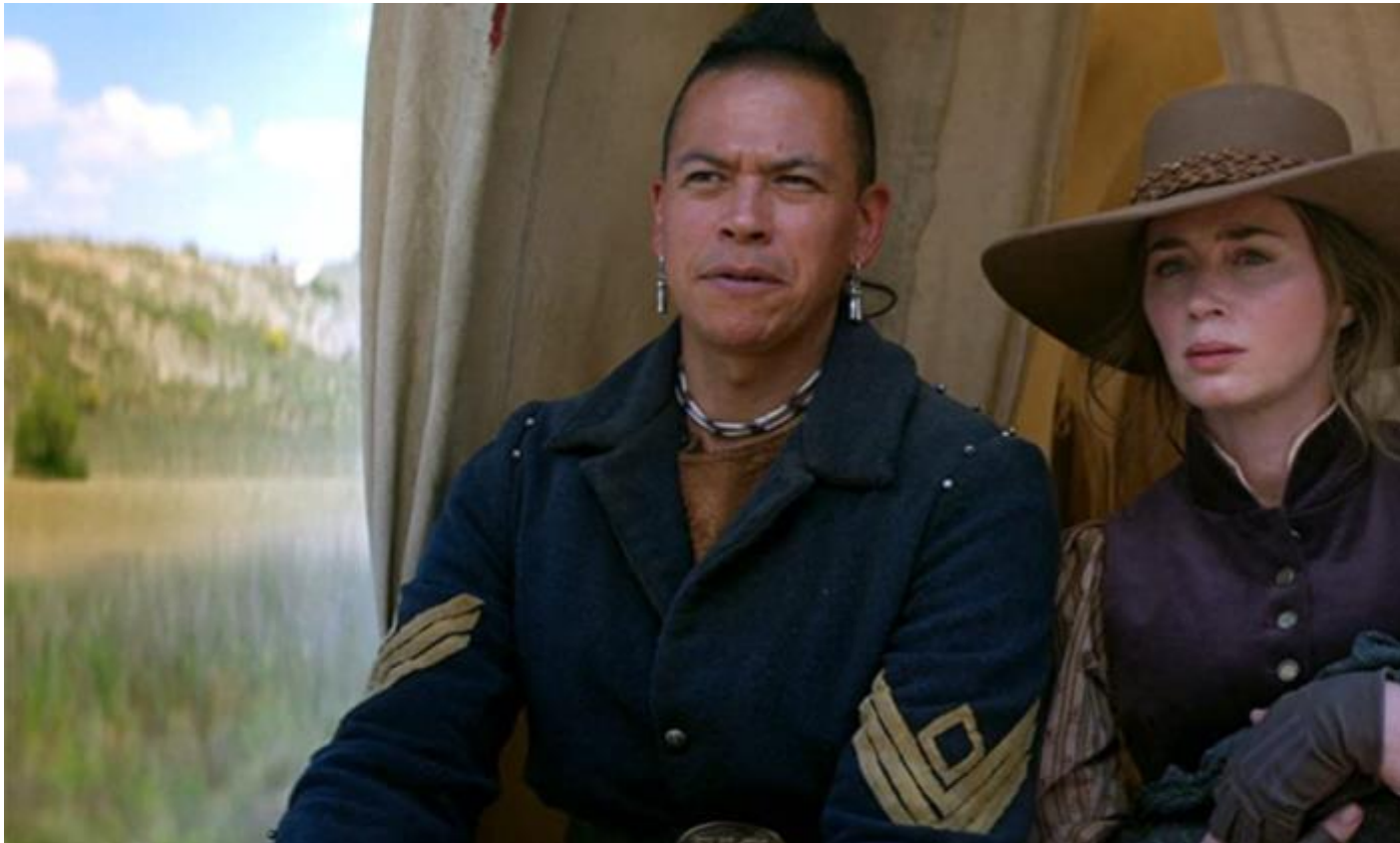
Chaske Spencer, Emily Blunt