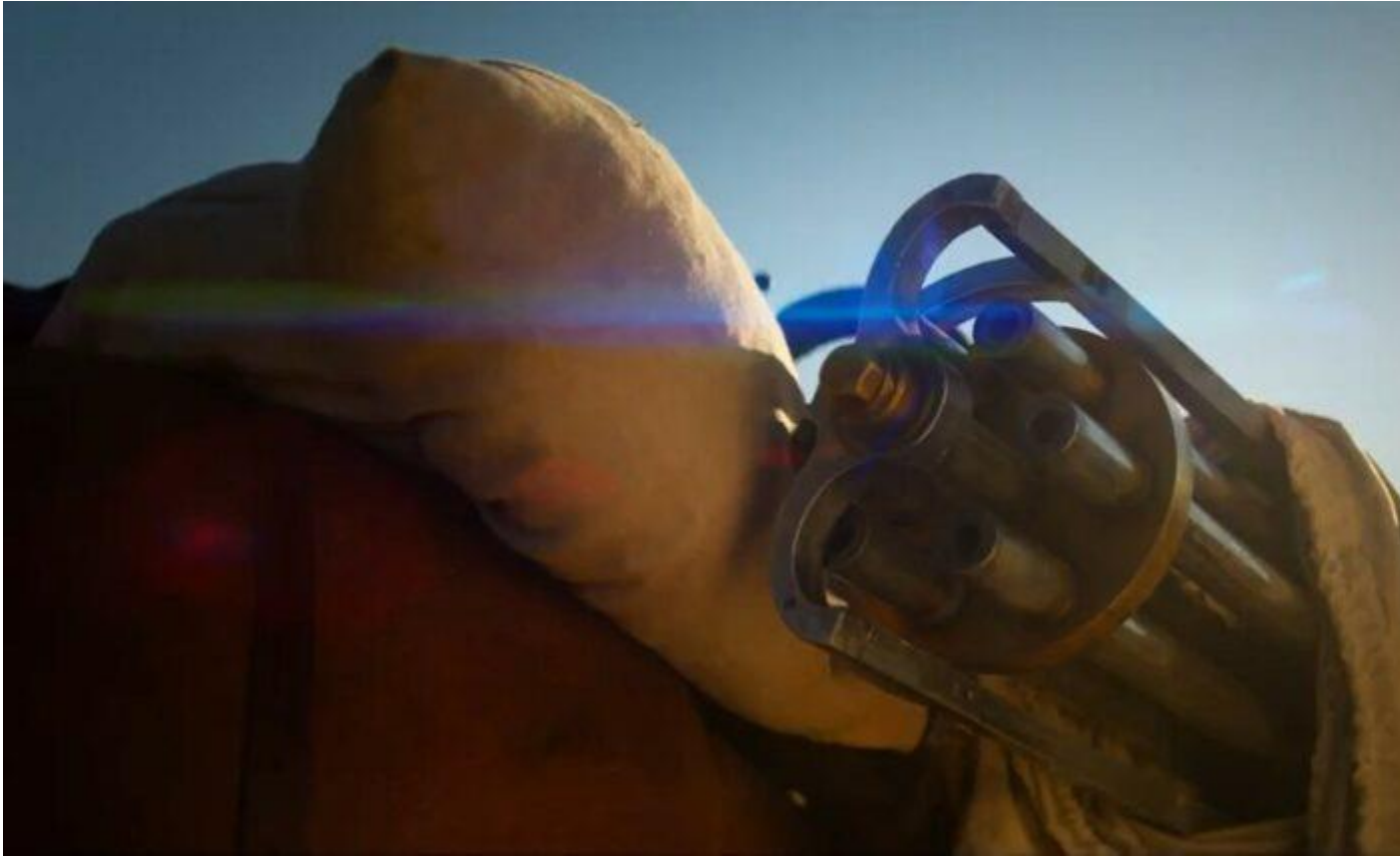
Az Angolok: Gatling-géppuska

Cornelia nyugatra érkezésének motívumában nem lehet nem észrevenni az elbeszél sorseseeményeit tekintve ugyancsak elsősorban kihagyásokkal, elliptikus megoldásokkal leírt Jill McBain otthonra találását. Blunt „tisza nője” nem kevésbé gyorsan tanuló, az extrém körülményekhez viharos sebességgel alkalmazkodó jelenség, aki végül furcsa módon, ideiglenesen bár, de autentikus figurájává válik ennek a világnak, ugyanúgy, mint Leone klasszikusában Cardinale prostituáltja.