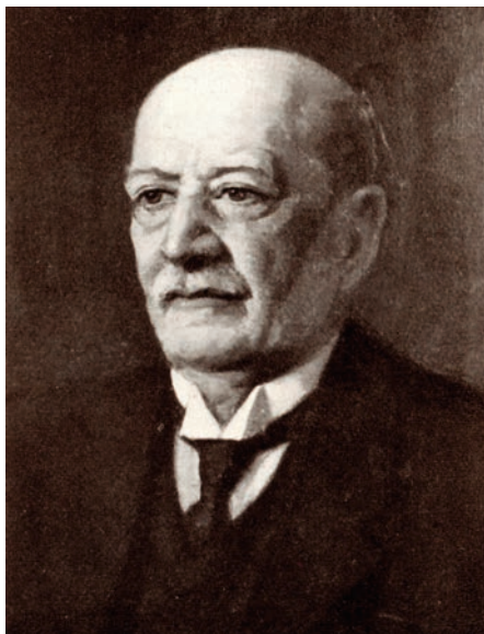
31. kép Farkas Lajos (1841–1921), a római jog professzora (1873–1915)

erkölcs, nyelv, tudomány, művészet, ipar, gazdaság és jog stb. fejlődésének phásisai, az érintett eseményekkel kapcsolatban fel nem öleltetnek.”