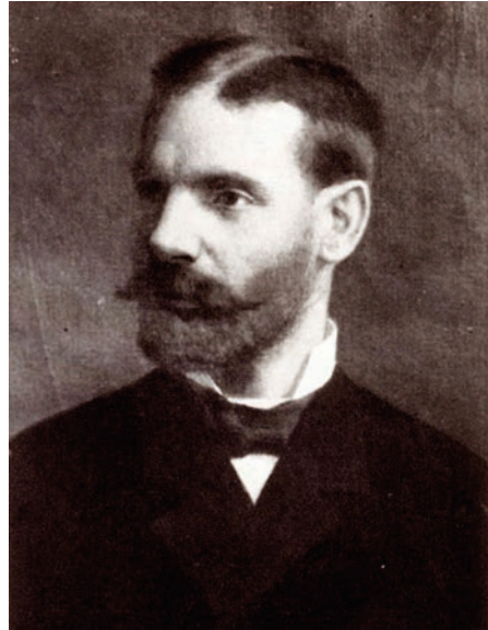
34. kép Plósz Sándor (1846–1925), a magyar polgári perjog professzora (1872–1881)

A kormány megbízásából már 1885-ben kidolgozta a polgári perrendtartás tervezetét, 189 s még további törvény-előkészítéssel is foglalkozott. 190 Nevéhez fűződnek a sommás eljárásról szóló törvény több rendbeli javaslatai, valamint a házassági ügyekben követendő eljárás tervezete. A bünvádi perrendtartásról szóló törvény (1896. évi XXXIII. tc.) életbe léptetésének munkájában fáradhatatlan buzgalommal vett részt, elnökölt az 1899 májusától 1900 februárjáig ülésező szaktanácskozásokon, és nagy része volt az életbe léptetés alkalmából megjelent 14 rendelet szerkesztésében (a királyi ügyészség, az ügyészségi megbízottak, a nyomozóhatóságok, valamint a csendőrség részére kiadott utasítások és a büntető ügyviteli szabályok). Azonban szerteágazó munkásságának 191 legkimagaslóbb eredménye mindenképpen