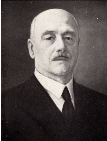
33. kép Menyhárh Gáspár (1868–1940), az ausztriai, majd magyar magánjog professzora (1911–1939)

az igazságügy-miniszteri tiszttel említendő 1899 és 1905 között. 188 1914-ben főrendiházi taggá vált.