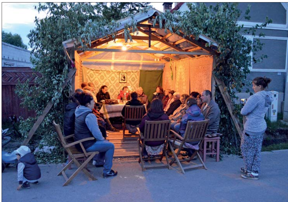
2. kép Imádkozás a kalibában. Csíkmadaras, 2018