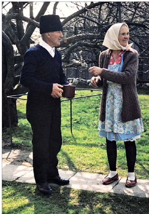
3. kép Előkészület a húsvét vasárnapi hajlékszentelésre. Csíkszentdomokos, 1995