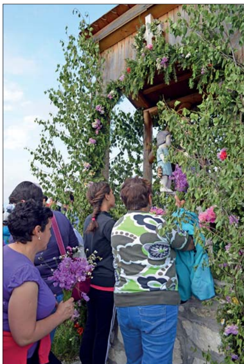
10. kép Érintőzés a Szent Antal napi búcsúban, a Szent Antal szobornál. Csíkszentdomokos, 2017