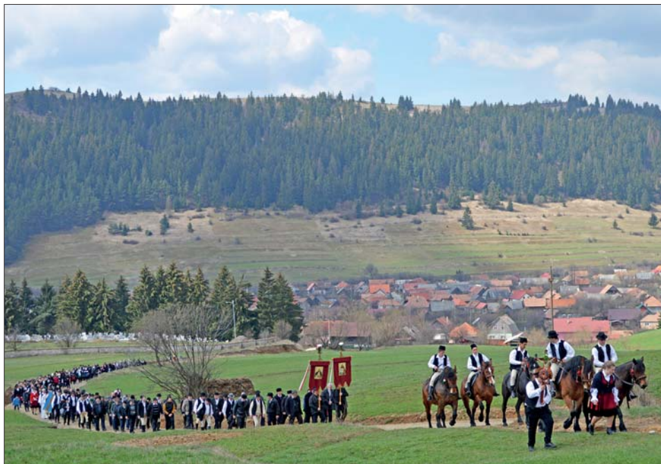
8. kép Búzaszentelő körmenet. Csíkszentdomokos, 2021