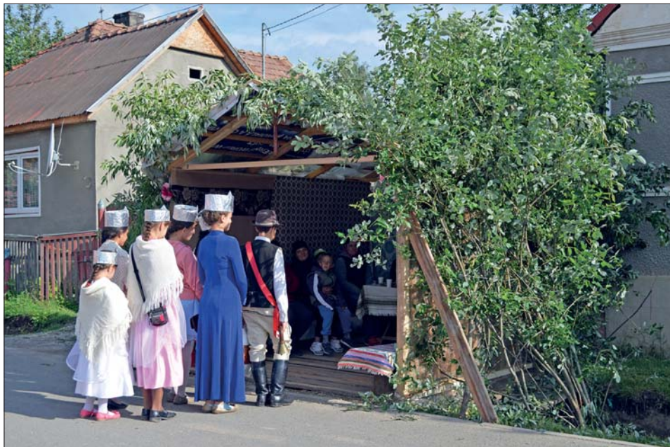
1. kép Angyalozók a kaliba előtt. Csíkmadaras, 2018