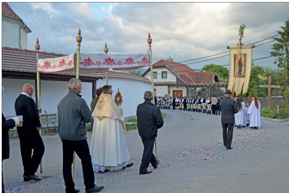
7. kép Úrnapi körmenet. Csíkszentdomokos, 2017