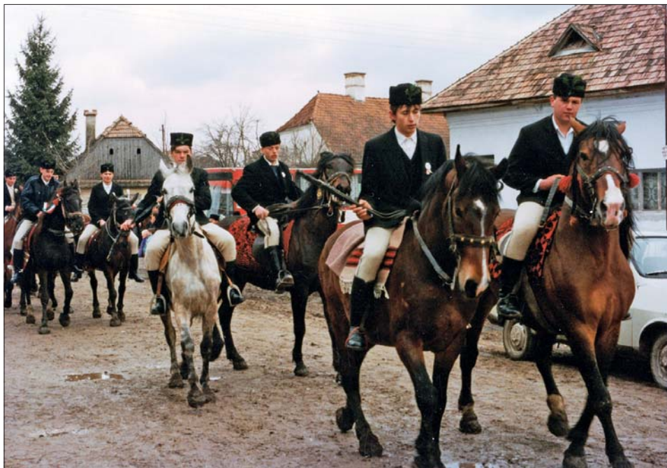
6. kép Határkerülő lovasok. Csíkszenttamás, 1997