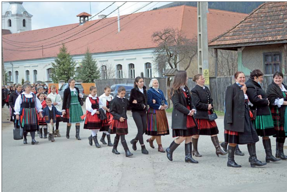
9. kép Szóttések vasárnapja. Csíkszentdomokos, 2021 (Fábián Gabriella)