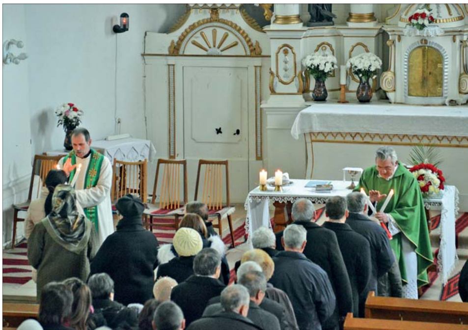
4. kép Balázs-áldás a csíkszentdomokosi templomban, 2018