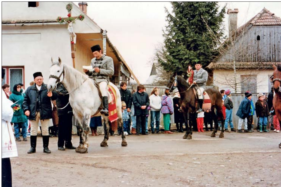
5. kép Határkerülő lovasok fogadása. Csíkszenttamás, 1997