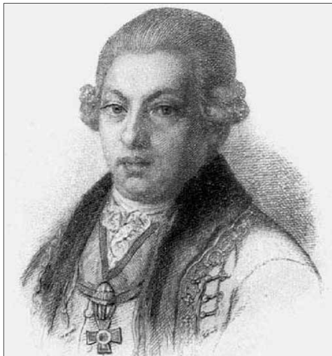
Gróf Niczky Kristóf portréja

hogy a magyar nemzet egyik nagy sérelmét „orvosolta”, azaz a Bánság inkorporálását véghezvitte. Ezt a kivételes életpályát azonban jelentősen beárnyékolta az akkoriban – Magyarországon is – népszerűtlen II. József iránti feltétlen hűsége és az uralkodó támogatása.