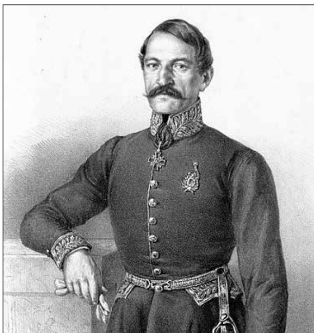
Ilija Garašanin (1812–1874), Nagy-Szerbia egyik megálmodója

A szerbek – 1848. március 17. és 1848. március 19. között tartott – pesti gyűlésükön nem-