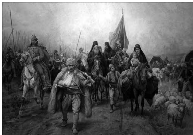
A nagy szerb vándorlás („Сео̀ба Ср̀ба”, „Seoba Srba”) 1690-ben

Magyarországra bevándorló szerbség nemcsak Koszovóból érkezett, hanem Niš környékéről, valamint a Morava-völgyből is. A migráció oka a korabeli hadieseményekkel magyarázható.