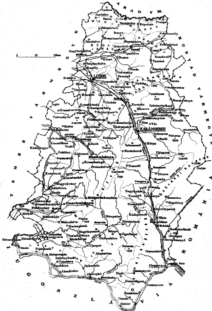
2. ábra: A történelmi Krassó-Szörény vármegye térképe (1910)