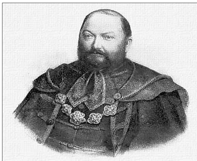
Hertelendi és vindornyalaki Hertelendy József főispán arcképe