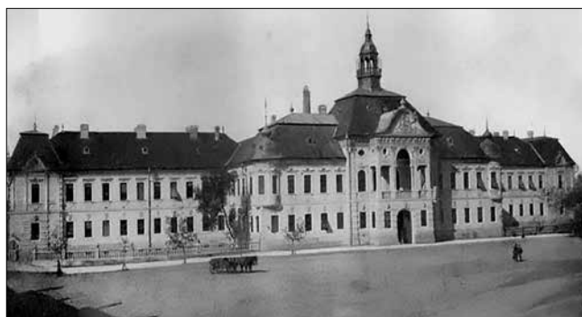
Torontál vármegye „új” székháza (1888) Nagybecskereken

Forrás: BOROVSZKY SAMU (szerk.): Torontál vármegye. Magyarország vármegyéi és városai . Országos Monográfia Társaság, Budapest, 1912. Országos Széchényi Könyvtár – Magyar Elektronikus Könyvtár, elektronikus elérhetőség: http://mek.oszk.hu/09500/09536/html/0024/14.html (Letöltés ideje: 2018. január 30.)