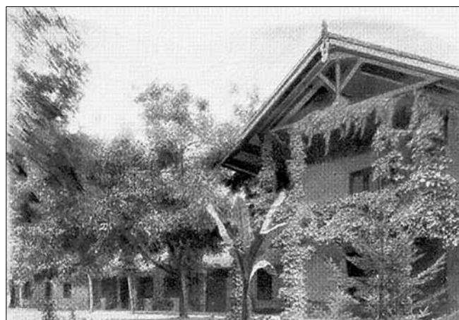
Dellimanics Lajos úrilaka Kurjácska-pusztán