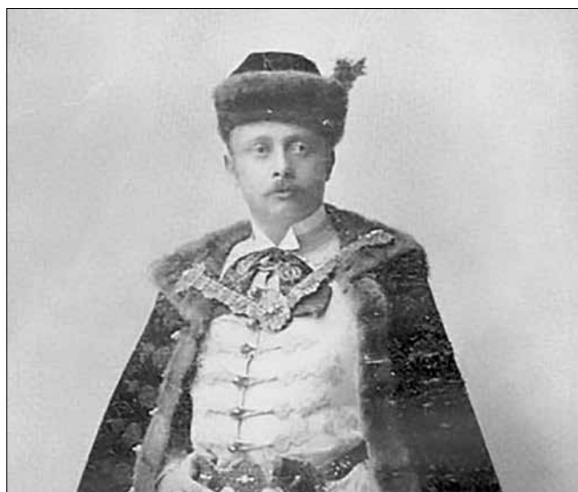
Dellimanics Lajos főispán fényképe