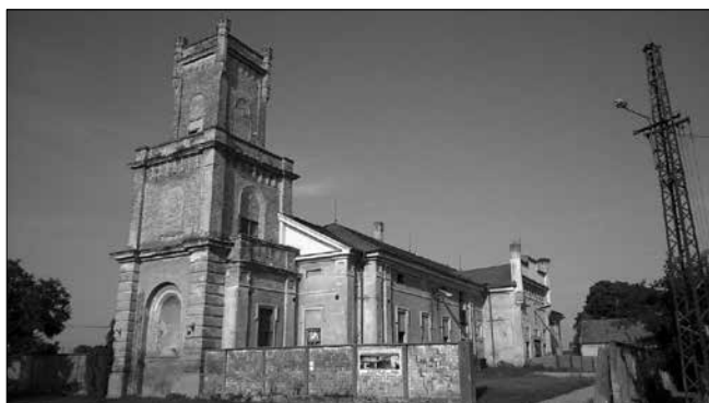
A kiszombori Rónay-kastély napjainkban (2017)

Forrás: BOROVSZKY SAMU (szerk.): Torontál vármegye. Magyarország vármegyéi és városai . Országos Monográfia Társaság, Budapest, 1912. Országos Széchenyi Könyvtár – Magyar Elektronikus Könyvtár, elektronikus elérhetőség: http://mek.oszk.hu/09500/09536/html/0024/14.html (Letöltés ideje: 2018. január 27.)