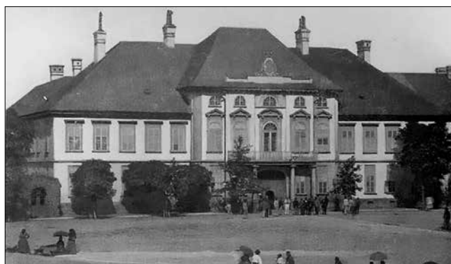
Torontál vármegye „rég”i” székháza (1820) Nagybecskereken