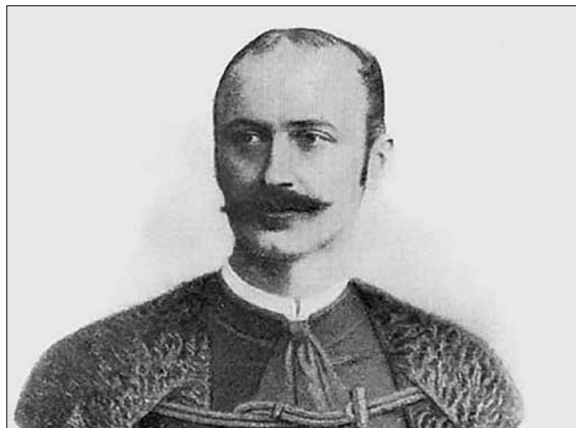
Zombori Rónay Jenő főispán arcképe

az ottani kórházban halálozott el belső vérzés következtében. Földi maradványait 1921. május 1-jén szállították haza, Kiszomborra, majd május 4-én a helyi temetőben található – ma is álló – Rónay-mauzóleumban helyezték örök nyugalomra. 57 Így végezte egy igaz ember, aki mindenkor szűkebb pátriájáért élt és dolgozott.