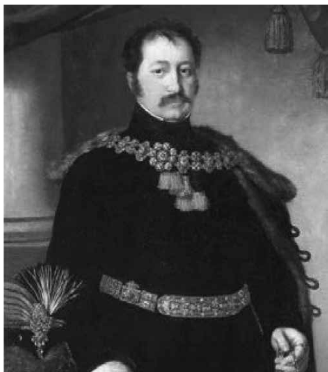
Hertelendi és vindornyalaki Hertelendy Ignác főispán arcképe**