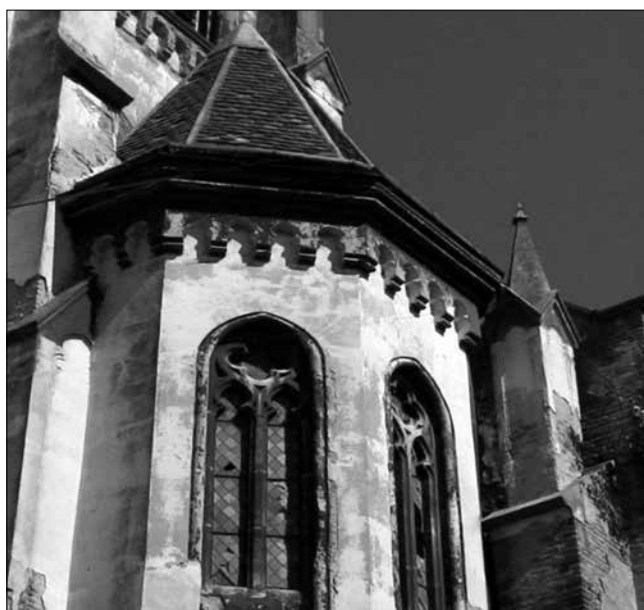
A módosi római katolikus templom (részlet)