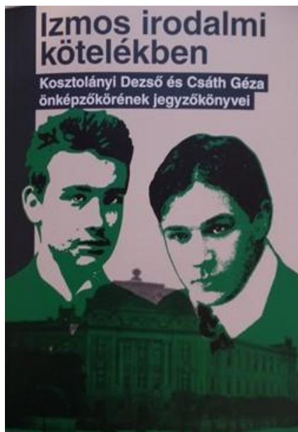
Izmos irodalmi kötelékben:

Kosztolányi Dezső és Csáth Géza önképzőkörének jegyzőkönyvei