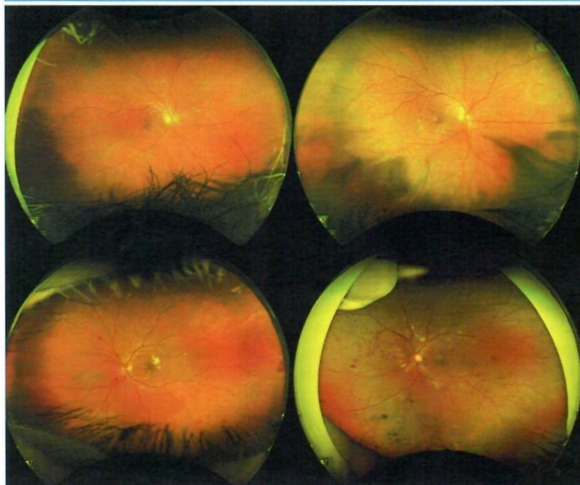
1. ábra: Az RD különböző stádiumai Optos-felvételeken

Minden magyar ember érdeke az, hogy az elkerülhető látásromlás és vakság előfordulási arányát csökkentsük. Ennek hosszú távú pozitív hatásai lennének mind társadalmilag, mind gazdaságilag. A következőkben azt a modellt fogjuk bemutatni, amellyel minden cukorbeteg számára elérhető gyors és biztonságos szűrészt kínálhatunk, amelyhez nincs szükség pupillatágításra sem. Az Optos ultraszéles látószögű funduskameráival akár 200°-os fotókat is készíthetünk a szemfenékről pupillatágítás nélkül, amely a retina 82%-át lefedi. Centrumonként 3-4 asszisztens végezné a felvételek készítését, így naponta akár 3600 embert is szűrni tudnánk országszerte, tehát minden cukorbeteg páciens évente lehetne vizsgálni. A felvételek kiértékelését egy országos központban végezné naponta 20, erre képzett szakember. Ha mesterséges intelligenciával dolgozó szoftvereket is használnánk, akkor akár ez a szám is csökkenhetne. Jelenleg hazai és nemzetközi fejlesztések folynak ezen szoftverek létrehozása céljából (7, 13). A kérdéses eseteket továbbítani lehetne a kirendelt szakorvosoknak, akikből naponta 1-1 állna rendelkezésre. A négy egyetemi központba egy-egy multifunkcionális Optos készüléket helyeznénk, amely OCT-t, fundusfotót, fluo-