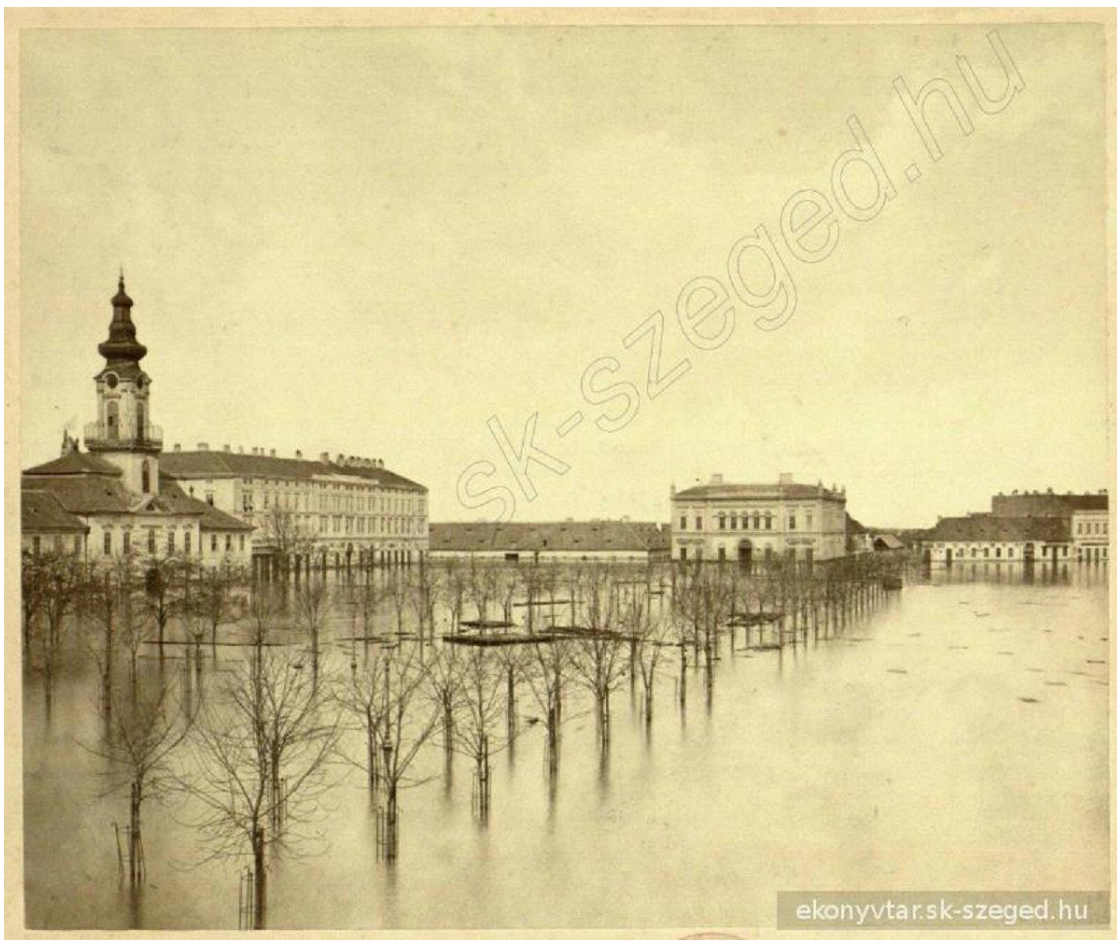
Szegedi nagyárvíz, Széchenyi tér