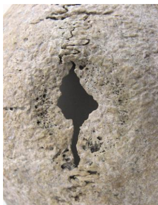
1. ábra: Zákányszék-Zákánydűlő NY/69., 1. sír, 40–50 éves nő sebészi trepanációja.

2004-ben Balogh Csilla és Türk Attila végeztek leletmentő feltárást a lelőhelyen. Az 52. objektumból egy senium korú férfi csontváza került elő. A koponya erősen hiányos, a homlokcsontjának hátsó részén, a bal margo supraorbitalétól 68 mm-re egy elnyújtott trepanációs nyílás részlete található. A seb mérete 46×27 mm (2. ábra; Bereczki és mtsai 2007). A nyílás laterális része vélhetően post mortem károsodott, de körben mindenhol jól látható rézsútosan ellaposodó peremek veszik körbe (legnagyobb szélesség 17 mm), amelyek a nyílás közepe felé lejtnek. A maradványok az SZTE Embertani Tanszékének gyűjteményében találhatóak.