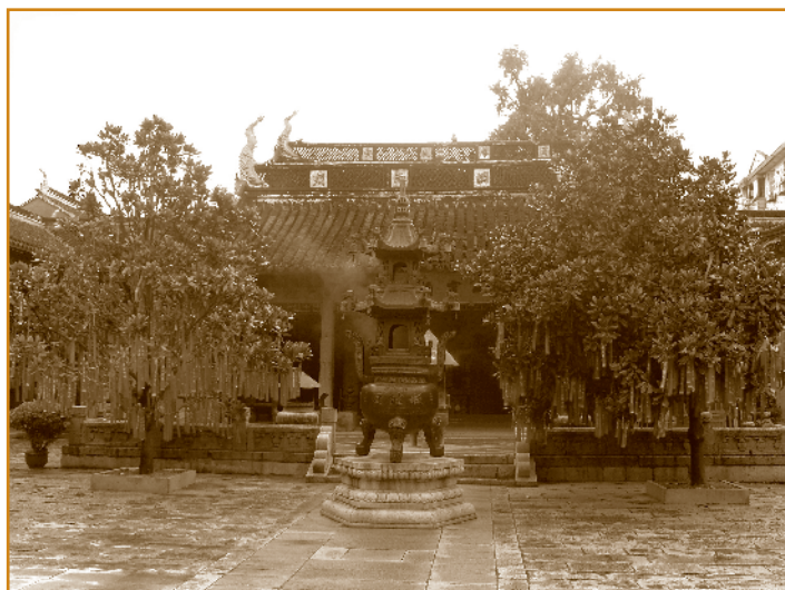
Shanghai: buddhista templom