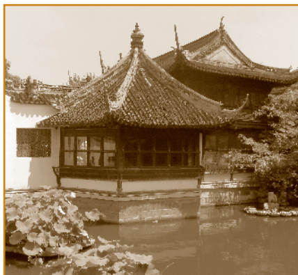
Yu Yuan Garden

A Szegedi Tudományegyetem és a Shanghai Politikatudományi és Jogi Egyetem együttműködési megállapodása alapján az érintett karok – elsősorban az SZTE ÁJTK – tervezik egy közös oktatási és kutatói program elindítását 2012-től, amelynek keretében hallgatói és oktatói mobilitásra,