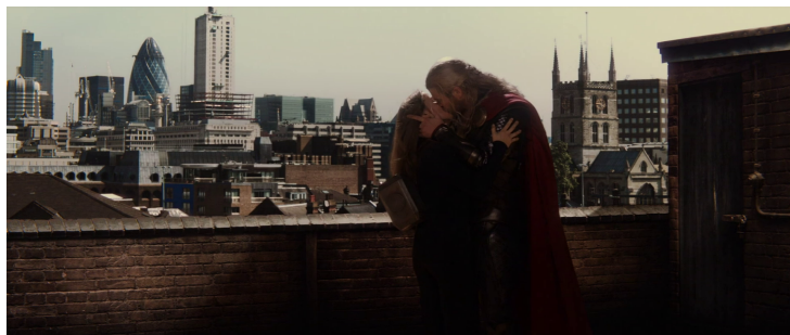
Thor és Jane csókja a Thor legvégén, amikor is a színésznőt Elsa Pataky, Chris Hemsworth felesége helyettesítette.