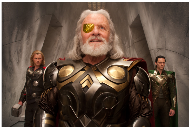
A Thorban Asgard – Odin szavaival – „reménysugár, mely átragyog a csillagok között”; vajon ez a 21. század eleji Egyesült Államok allegóriája?

Kivételes harci bátorságuk ellenére egyértelmű, hogy az asgardiaiak kisebbségben vannak és gyengébbek, a vereség pillanatában azonban mitikus nyolclábú lován, Sleipniren lovagolva Odin tűnik fel. „Atyám! Együtt végzünk velük!” – szólítja Thor az apját, ami erősen megidézi, hogyan gondolt sokak szerint George W. Bush az iraki háborúra. [8] Odin azonban figyelmen kívül hagyja a fiát, és Laufey-hez fordul: „Ezek egy fiú cselekedetei, kezeld akképpen” – s ez a második eset néhány percen belül, hogy Thort fiúnak nevezik. Laufey azonban nem áll kötélnek, és a civilizációk összecsapása [9] az asgardiaiak és a Jégóriások között újrakezdődik.