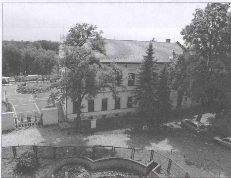
A sárospataki Római Katolikus Egyházi Gyűjteménynek otthont adó Szent Erzsébet Ház

ben található muzeális könyvszekrények. A bennük található régi könyvek reprezentatív szerepet is betöltöttek. 2012-ben egy újabb nyertes pályázatnak köszönhetően a ház új bútorzatot, könyvespolcokat, katalógusszekrényt kapott. Így méltó és állományvédelmi szempontból megfelelő helyre került a könyvállomány. 2013-ban kulturális közfoglalkoztatott fiatalok közreműködésével megkezdődött a dokumentumok felmérése. Autopszia alapján történt a könyvek tartalmi, formai feltárása, mivel új helyre került, ezért új raktári jelzettel kapott minden dokumentum. A számítógépes nyilvántartásban szereplő leírások bizonyos esetekben csak javításra szorultak, és csupán raktári jelzettel kellett őket kiegészíteni, sokszor azonban egyszerűbb volt új katalógusrekordot készíteni. Minden esetben új dokumentumleírásra és cédulanyomtatásra volt szükség; a szerző és cím szerinti katalógus is újra kellett építeni. A két évig tartó munka során a huszonnégyezer könyvállomány minden egyes darabja sorra került. A könyvtár gyűjtőköre vallás és vallástudomány, lelkiségi irodalom, helytörténet, Szent Erzsébet és a Rákóczi család történetének szakirodalma. 2015-ben elkészült az állomány revíziója.