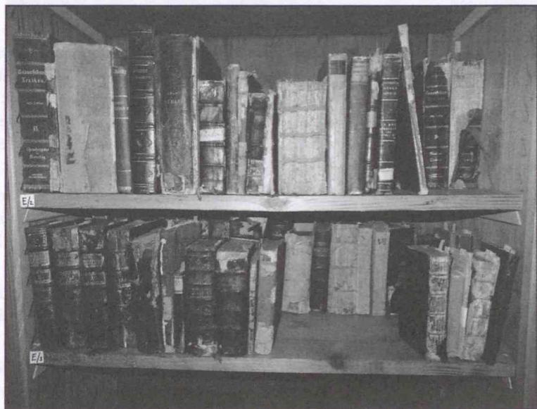
Könyvek a jezsuita könyvszekrényben