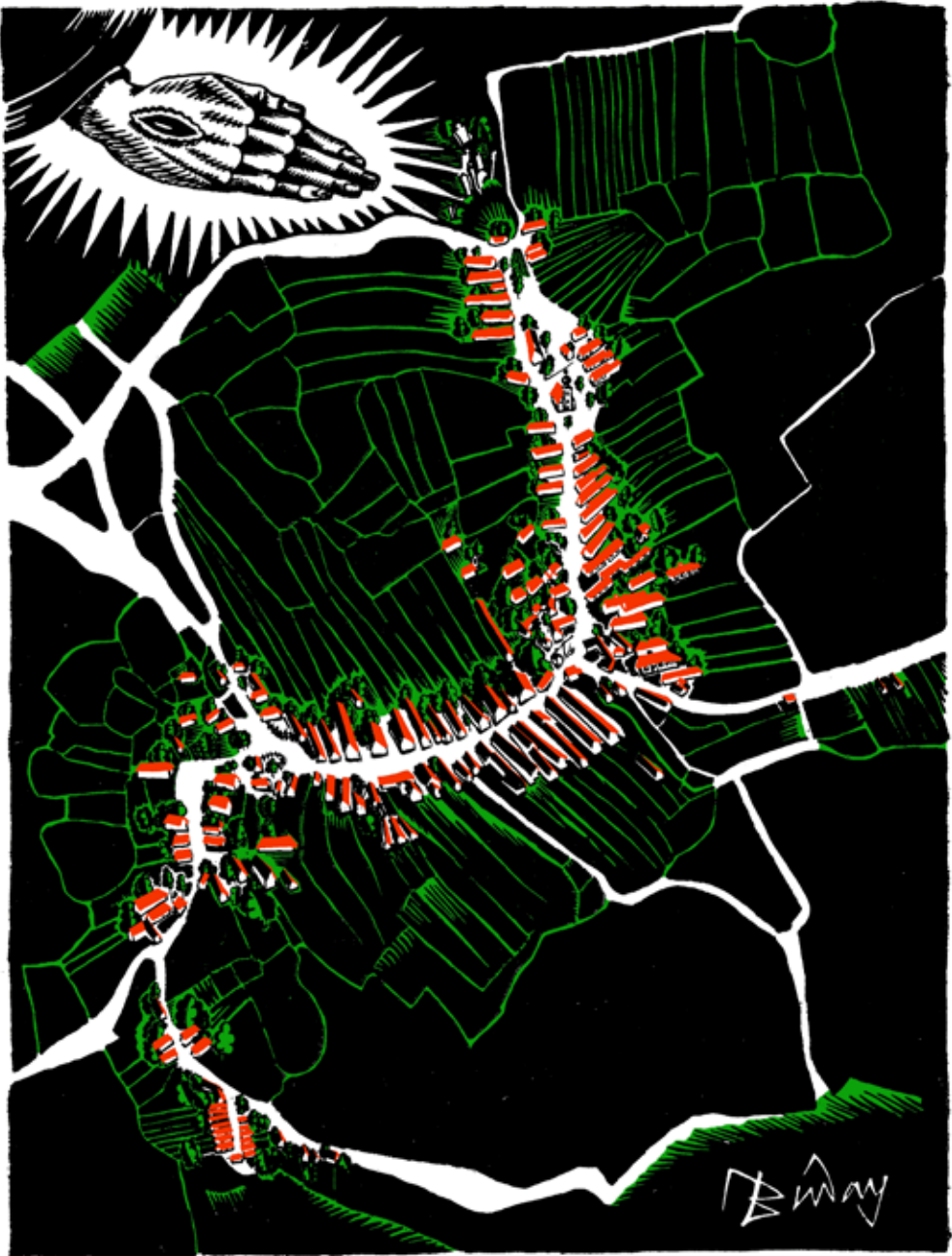
Buday György Duda térképét ábrázoló fametszetének színes változata. Rekonstrukció Buday György ötlete nyomán. Készítette: Nagy Ilona geográfus 2017-ben.