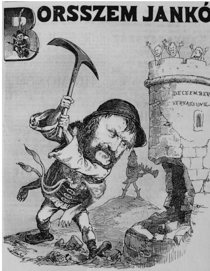
Forrás: Borsszem Jankó , 1871. október 15. 963.

A decemberi alkotmány lerombolási kísérlete a kormánypárti magyar olvasótáborban bizonyára nem növelte a csehek és törekvéseik népszerűségét. 1871-ben azonban a cseh–osztrák kiegyezés kapcsán felbukkanó másik fontos szereplő, Hohenwart ausztriai kormányfő is a címlapon láthatta magát viszont. A karikatúrán a miniszterelnök nyakon csípi a cseh kisgyermeket, a többiek (a lengyel és a klerikálisokat megszemélyesítő alak) már a puttonyából kukucskálnak. Hohenwartnak a Ciszlajtánia föderatív átalakítására irányuló tevékenységét pedig a következőképpen jellemzi a Borsszem Jankó : „Most a német–cseh kérdésben a kecske és káposzta megoldhatlan föladatával foglalkozik, s valószínűleg úgy