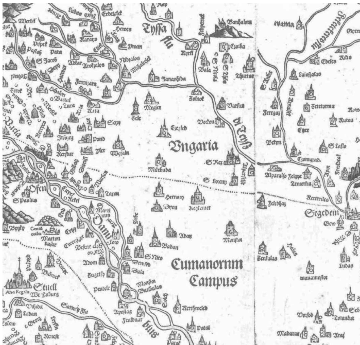
Рис. 6. Lazarus: Tabula Hungariae ad quatuor latera per Lazarum quondam Thomae Strigonien Cardin. Ingolstadt, 1528 (деталь).

кунов (по закону 1279 г. они стали равными с венгерскими дворянами) были обязаны поступать на военную службу только за счёт короля. То есть куны получали жалование, если участвовали в походах короля. Это некоторым образом компенсировало недостающую добычу (плату за пленных) [Györffy, 1990a, с. 286-288]. Так в войнах королей Кароя Роберта/Károly Róbert (Карл Роберт / Шаробер) (1301–1342) и Лайоша/Lajos (Людовика) Великого (1342–1380) куны участвовали в качестве наёмников. Церковь тоже стремилась некоторое время угождать кунам. Для того, чтобы крестить как можно больше из кунов, в 1328 г. римский папа освободил их от десятины. В 1351 г. их обязали платить только тридцатую долю (вид пошлыны).