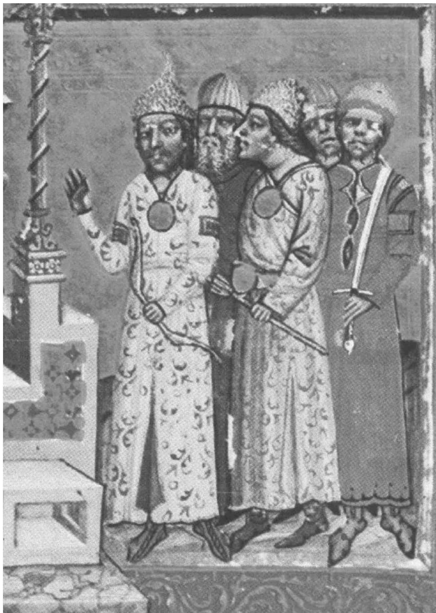
Рис. 5. Знатные в costume «восточного» типа – военачальники лейбгвардии или вспомогательных отрядов короля по левую сторону от сидящего на троне короля Лайоша I (Великого). Первая миниатюра титульной страницы Венгерской иллюстрированной хроники (деталь) (Képes Krónika I.1).

с. 1-23], которая была характерна для кочевнических обществ. Но попытка обратиться к кочевническим традициям была обречена на провал. Наконец, в 1290 г. Ласло был убит кунскими вельможами (Арбуз, Тёртел и Кемече / Arbuz, Törtel, Kemece), не исключено, что при поддержке венгерской знати (рис. 4). 29