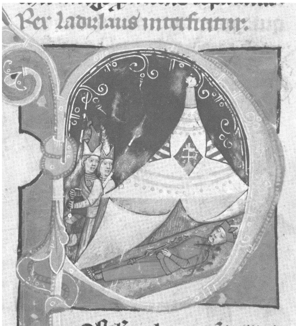
Рис. 4. Смерть (убийство) венгерского короля Ласло IV („Кун”). Миниатюра в инициале „P” Венгерской иллюстрированной хроники (Képes Krónika I. 129).

опираясь на них, мог бы парализовать власть групп вельмож (магнатов), поэтому не удивительно, что король откладывал исполнение закона. Из-за этого папский легат отлучил его от церкви. Тогда король дал обещание исполнять закон, но бежал к кунам. С этого времени Ласло начал следовать кунским обычаям. У него была кунская любовница по имени Эдуа (Édua). Ласло передал папского легата кунам, после этого магнаты схватили короля. Ласло IV был вынужден снова согласиться на исполнение закона, но этот шаг вызвал бунт кунов, обитавших между реками Кёрёш (Körös) и Нижним Дунаем. Они разграбили территорию и хотели покинуть Венгрию, но король успел воспрепятствовать им в их намерении [Györfly, 1990a, с. 285; Szűcs, 2002, с. 428]. Однако прежнее спокойствие не вернулось, и в 1280 г. король снова был вынужден взяться за оружие против кунов и нанёс им тяжёлый удар в битве при озере Ходто (Hódtó) [SRH, I, с. 471-472]. Вследствие этого куны ушли из междуречья Кёрёша (Körös) и Мароша (Maros) и бассейна реки Темеш (Temes).