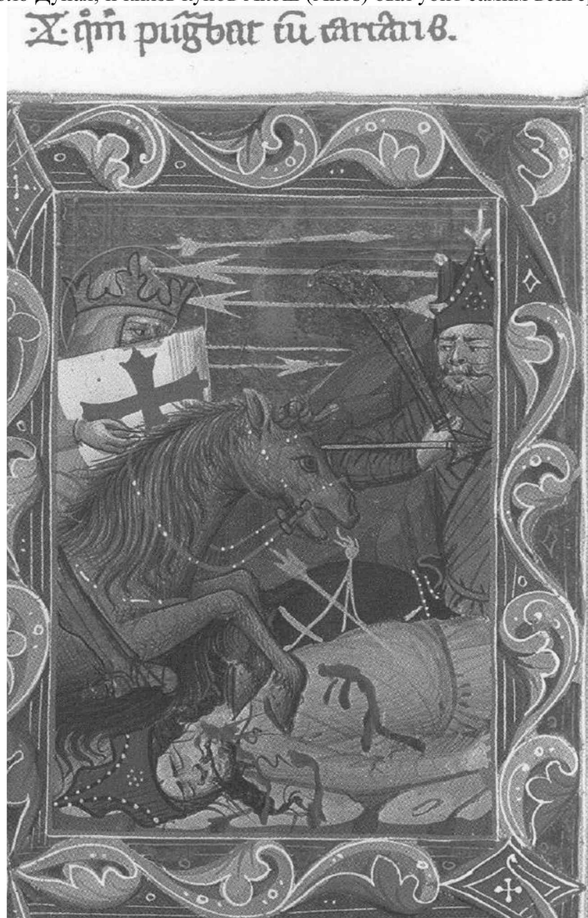
Рис. 2. Бой князя Ласло с куманами. (Magyar Anjou Legendárium, XLIV/10).

после Бихара переплыли Тису около Токая (Токај), а потом войско разделилось на три части, совершая набеги на территории, которые находились на запад от Тисы. Около Бече /Becse/ (ныне Бечей в Сербии) они решили вернуться на родину. Недалеко от этого места, около притока реки Темеш (Temes), на берегу ручья Поганиш /Poganiš/ (ныне Poganiș в Румынии), король Ласло I победил кунов Копулча. 14 По данным хроники, куны хотели отомстить венграм за поражение и ещё раз напали на Венгрию. Но этот новый поход тоже закончился поражением около Дуная, и князь кунов Акош (Ákos) был убит самим венгерским королем. 15