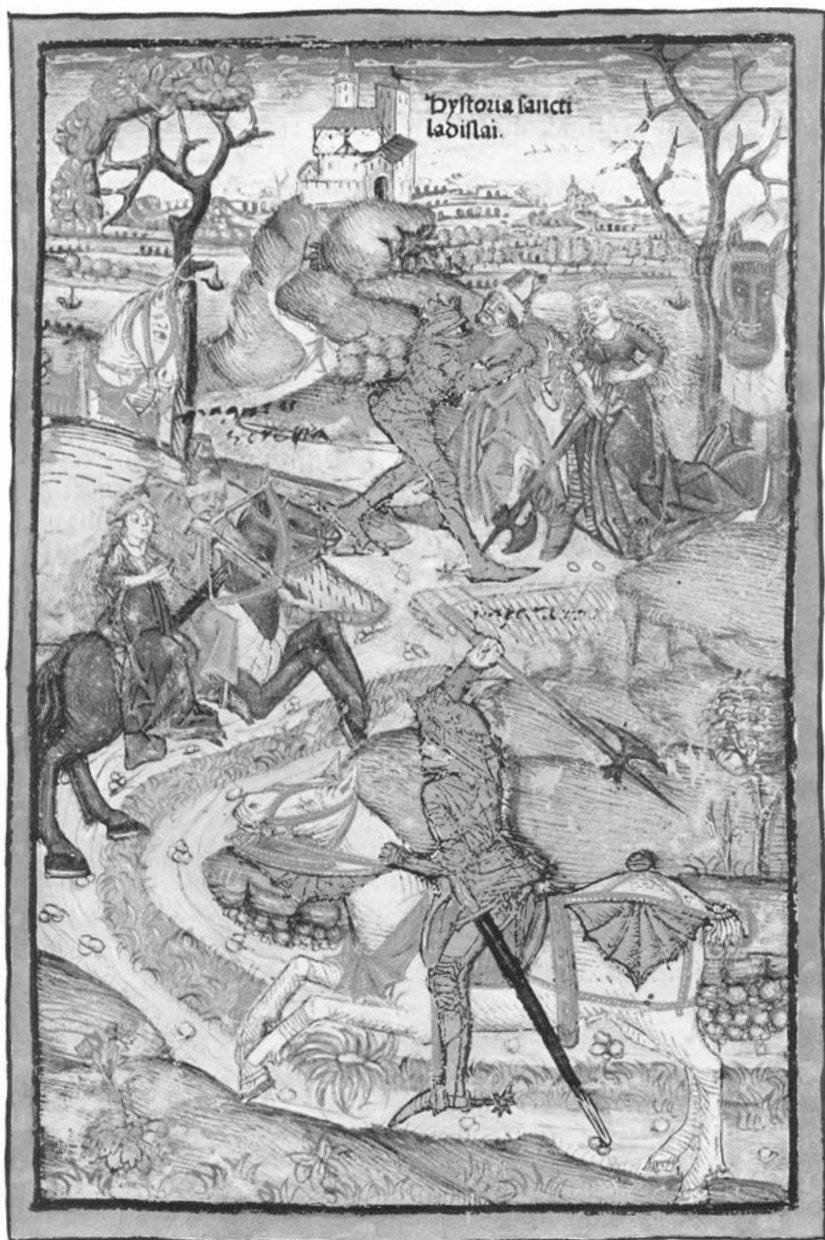
3. Szent László és a leányrabló kun harca. Színes fametszet (Thuróczy János: A magyarok krónikája , Augsburgban nyomtatott kiadásából, 2a. lap).