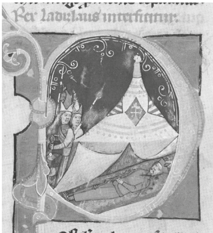
4. IV. (Kun) László király megölése. Miniatúra „P” iniciáléban (Képes krónika I. 129)

sikeres. Végül 1290-ben IV. Lászlóval – nem kizárt, hogy magyar bárók mesterkedése következtében – kun előkelők (Arbuz, Törtel és Kemece) végeztek. 81