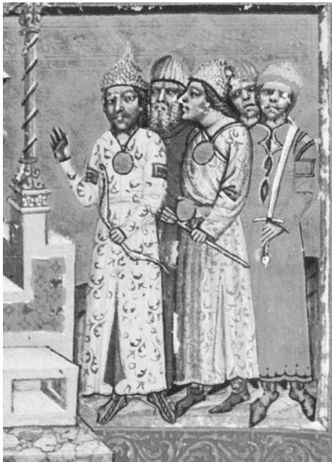
5. Keleti ruhás előkelők – testőrök vagy a katonai segédnépek vezetői – a trónon ülő I. (Nagy) Lajos király bal oldalán. A Képes krónika címlapjának első miniatúrája, részlet (Képes krónika I. 1)

során. Ez némiképp kárpótolta őket a kiesett emberzsákmányért. 82 Így Károly Róbert (1301–1342) és I. (Nagy) Lajos (1342–1382) külhoni hadjárataiban a kunok zsoldosként vettek részt. Az egyház is igyekezett egy ideig kedvezni a kunoknak. Annak érdekében, hogy minél több kun vegye fel a kereszténységet, a pápa is elengedte a dézsmát 1328-ban. 1351-ben csak harmincad fizetésére kötelezték őket.