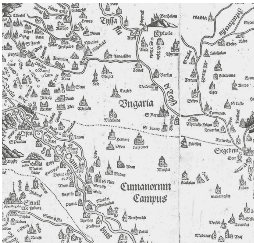
6. Lazarus: Tabula Hungarie ad quatuor latera per Lazarum quondam Thomae Strigonien Cardin. Ingolstadt, 1528 (részlet)

végül a nyelvüket is feladták. A beilleszkedésük olyan sikeres volt, hogy a 14–15. században az Alföld az ország leggyorsabban fejlődő területei közé tartozott, és a paraszti lakáskultúra is itt volt a legfejlettebb.