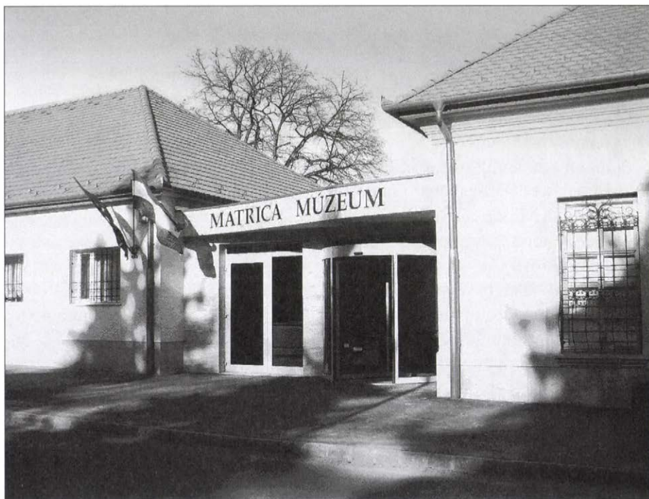
2. kép. Matrica Múzeum.

A kulturális és oktatási intézmények közül az 1982-ben átadott Sportcsarnokot, valamint az ugyanebben az évben átadott Városi Strandot kell megemlíteni, az 1985-ben működését megkezdő Barátság Művelődési Központot és Városi Könyvtárat, a ma már Hamvas Béláról elnevezett kulturális intézményt. A kultúra iránti igény kielégítésére szolgáltak emellett a klubok, kulturális csoportosulások, amelyek a helyi kis közösségek megtartásában és újjáéledésében,