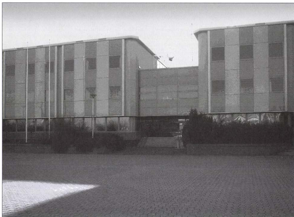
3. kép. Polgármesteri Hivatal a város szívében. (Saját fotó, 2008.)

a hagyományok őrzésében rendelkeztek kiemelkedő szereppel, illetve a régi és az újonnan betelepülő lakosok közötti kapcsolatok kiépítésének pilléreiként is szolgáltak. A közintézmények utolsó nagyberuházásai közül az 1987-ben felépült muzeális intézményt, a Matrica Múzeum, továbbá a helyi szakemberek képzésében jelentős szereppel rendelkező Széchényi Ferenc Szakközépiskola érdemel említést.