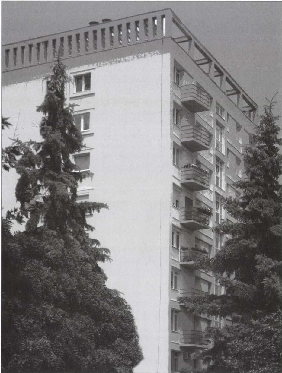
4. kép. Lakótelep az ezredforduló küszöbén.