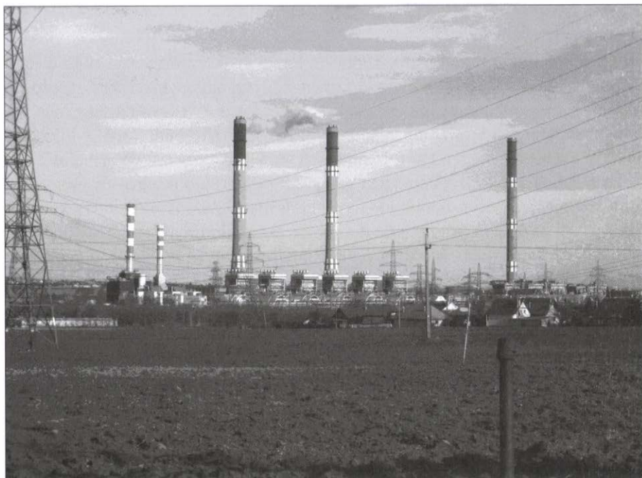
7. kép. Kifelé a városból. (Saját fotó, 2008.)

is a két működő nagyvállalat lététől függ a városfejlesztés irányvonalainak korszerű alakulása.