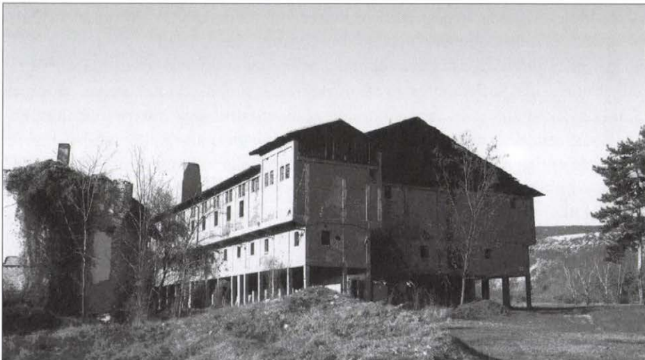
1. kép. A Bhon-Drasse által létrehozott Téglagyár (saját fotó, 2008.)

A gyár, amelyet az óbudai székhelyű Bhon-Drasse Társaság létesített a délbudai térség téglagyaraként, 1896-ban kezdte meg működését, az Érd-Batta közötti lösz dobok déli részén a Duna-partján. A téglagyár területén található egyéb épületek, mint pl. a kultúrház és a gangos lakóház is ezekből a téglákból épült. Később megépült a téglagyár melletti kikötő, amely lehetővé tette, hogy Magyarország déli városaiba uszályokon keresztül juttassák el a téglákat. 4 A gyár 1916-ban végül bezárta kapuit, bár az 1920-as években még egy próbálkozással élve, a gyárat újraindították, de csak ideiglenes jelleggel.