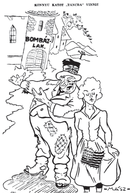
Churchill: „Kicsikém ne tétovázz...”