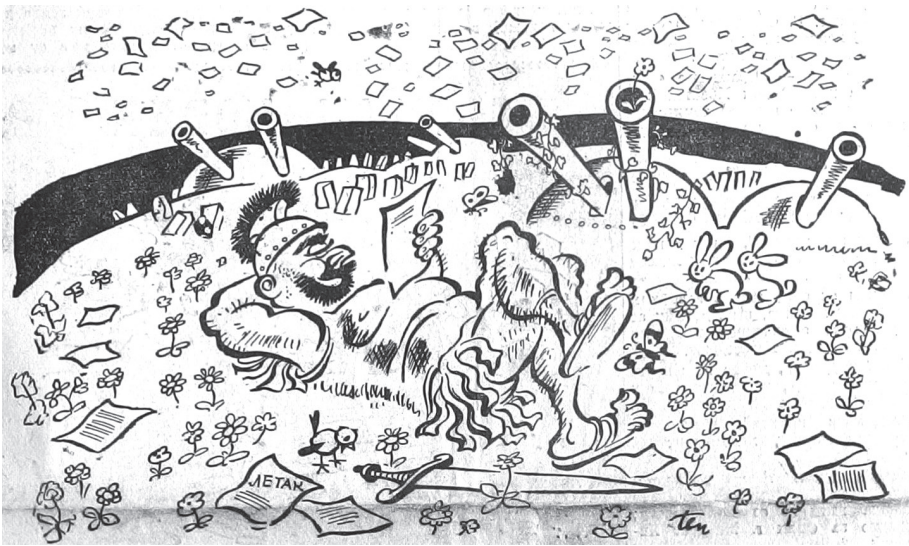
1. kép „A háború első hónapja a nyugati fronton”

és női tagjai eltérők lehettek a rajzokon, felbukkant Franklin D. Rooseveltt amerikai elnök és Winston Churchill brit miniszterelnök, de „a zsidóság” is lehetett a kigúnyolt nász egyik résztvevője. 33 A Magyarság a vérszomjas Marsot ábrázolta, összekapcsolva jelenlétét és pusztítását a „zsidósághoz köthető pénzzel, nyereszke- déssel, háborúból származó profittal.” A Kladderadatsch ban tovább gondolták ezt a motívumot, s egy torzrajzon a „zsidó attribútumokkal” rendelkező háborúisten borítja lángba az egész Földet. Mars legutolsó alkalommal halálként látható min- két lapban. 34