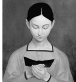
Gustav Adolph Henning: Olvasó lány című képe (1828), Leipzig, Museum der Bildenden Kunst.

Nem kétséges, hogy e képek sokkal többek pusztán művészeti ábrázolásnál, beállításnál. Egyfelől egy korszak tükörképei, hiszen a századforduló tömegtermelése, a hazánkban ekkor kibontakozó egyházi könyvkiadás elárasztotta a piacot imakönyvekkel, lelki olvasmányokkal. Ebben a nőknek szánt termékek kiemelt helyet kaptak, az imakönyv valóban az egyik tipikus női műfaj lett. Ennek háttérében részben a 19. század második felétől megfigyelhető sajátos női spiritualitás kibontakozását említhetjük. Több adat és kutatás mutat rá arra, hogy a jelzett korszakban érezhetően hangsúlyossá vált a nők egyházban, vallási életben és gyakorlatokban való részvétele. Egyes társadalomtörténeti munkákban ezt a folyamatot a vallás (néhol a klérus) feminizálódásaként írták le. 1