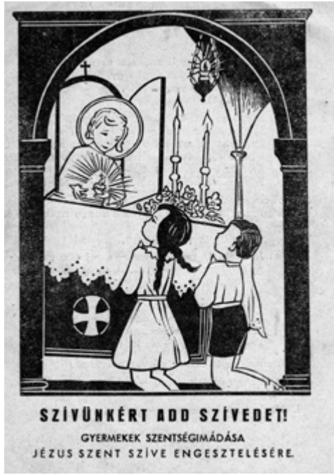
Tabernákulum közepén Jézus Szíve ábrázolással. Ponyva címlap (1949), SZTE BTK Néprajzi Tanszék