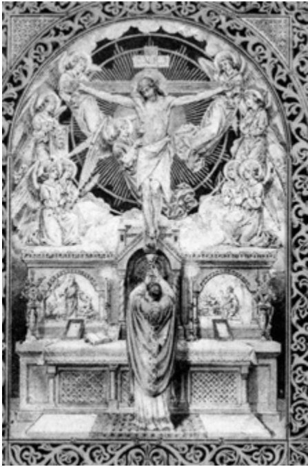
Tabernákulum közepén a keresztre feszített Krisztussal. Kisszentkép (20. sz.), SZTE BTK Néprajzi Tanszék tulajdona.

szimbólumra utal, mely szerint az Eucharisziát rejtő tabernákulumban Jézus Szíve dobog. 57 Az ilyen jellegű képeken gyakran láthatjuk a keresztre feszített Krisztust is, emléktetve a kereszttáldozat tanára.