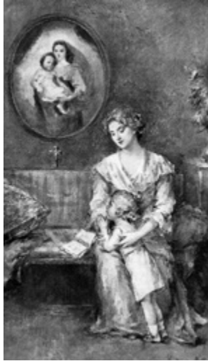
Illusztráció Ruschek Antal a Keresztény nő című könyvéből 1898-ból, R. Hirsch Nelli rajza.