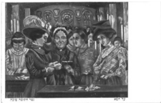
Újévi üdvözlés, képeslap (Nők a zsinagógai karzaton).