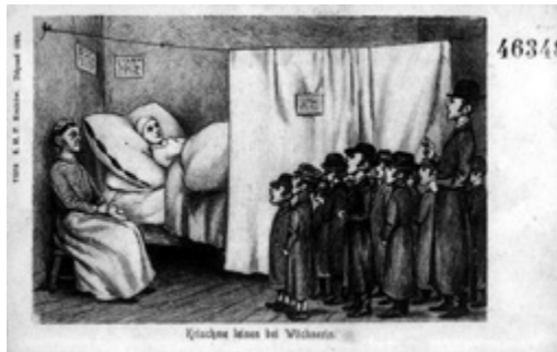
Ima a gyermekágyas nőért, képeslap. MILEV K751.

A nők mindennapi élethelyzeteihez írt imákban a nehézségek és szituációk nagyon széles spektruma tárul elénk, melyek végigvezetik a nőt élete egészen. Az alábbi táblázatban e női szükséghelyezetek sora látható. Az összevethetőség és viszonyítás kedvéért hasznosnak találtam feltüntetni néhány katolikus és protestáns női imakönyvben előforduló szükséghelyeztet is: