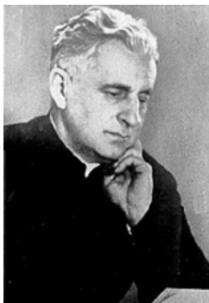
5. kép. Sík Sándor (1889–1963) piarista tartományfőnök, költő, irodalomtudós, akadémikus, egyetemi tanár. A Szegedi Fiatalok Művészeti Kollégiuma (1930–1937) és a Szegedi Egyetemi Ifjúság (SZEI) támogatója, mentora.