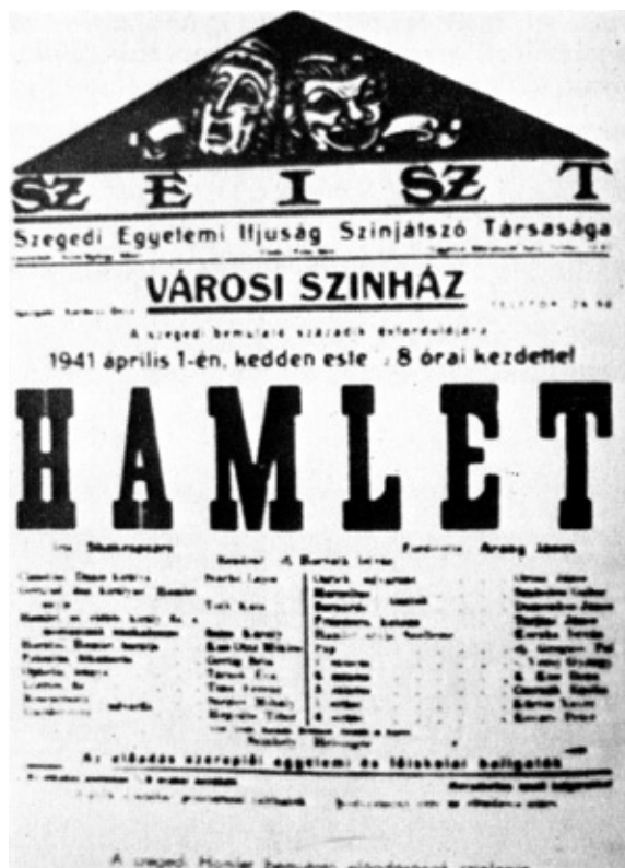
10. kép. A Hamlet szegedi előadásának plakátja.