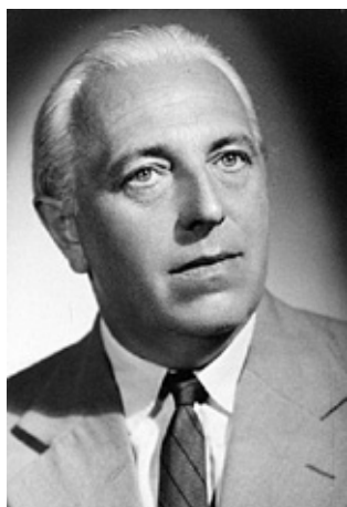
6. kép. Baróti Dezső (1911–1994) irodalomtörténész, egyetemi tanár, az egyetem rektora (1955–1957). A Szegedi Fiatalok Művészeti Kollégiumának (1930–1937) tagja, a Szegedi Egyetemi Ifjúság (SZEI) támogatója, mentora, később az 1956-os Magyar Egyetemisták és Főiskolások Szövetsége támogatója, mentora, az 1957. évi megtorlás áldozata.