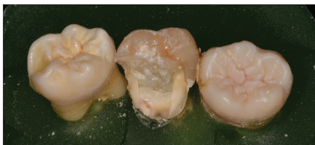
2. kép: Egy beágyazott minta, amin egy nem restaurálható törés látható.