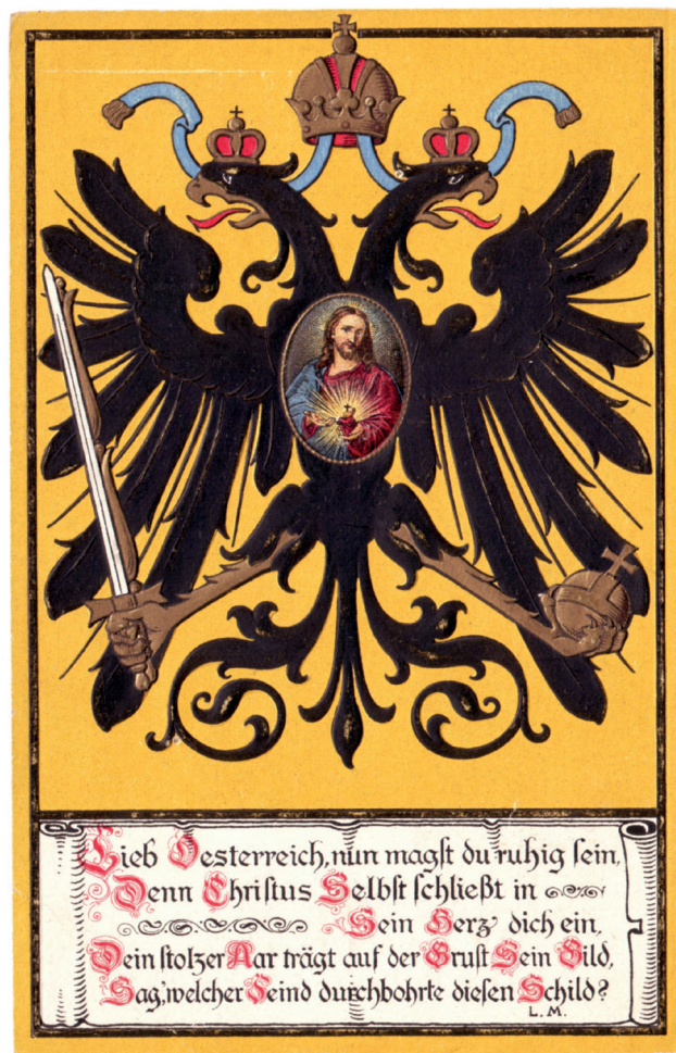
4. kép: Első világháborús propaganda képeslap, é.n. Josef Müller, München. Glässer Norbert tulajdona.