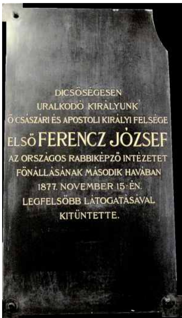
A rabbiszeminárium előcsarnokának emléktáblája