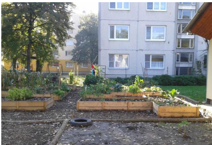
Figure 2. The Megálló Community Garden in Tarján neighborhood