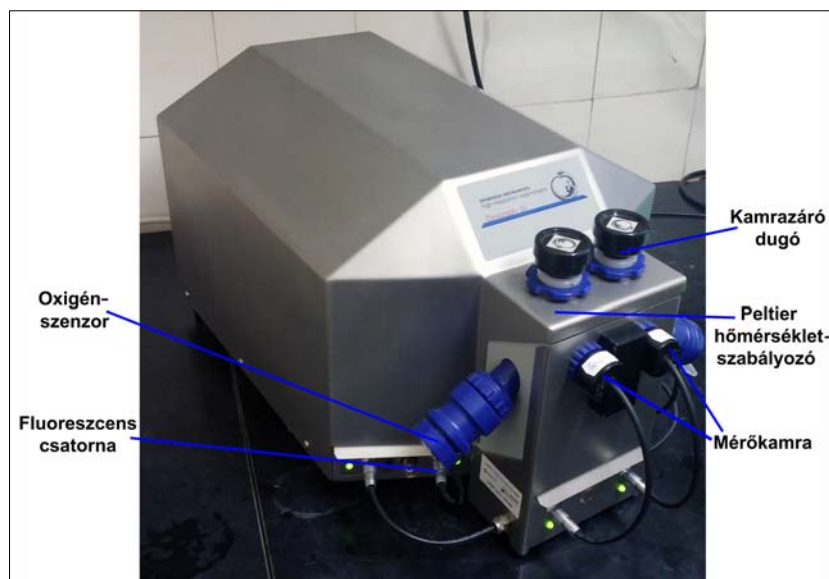
1. ábra. Oxygraph-2k nagy felbontású respirométer

riális elektrontranszportot, az oxidatív foszforilációt és az ATP-szintézis hatékonyságát lehet megítélni. 4 Az új generációs oxigráfokkal lehetőség nyílik kisméretű ( \geq 10 mg) minták, akár finomtű-biopsziát követő vagy műtétek során vett biopsziák fagyasztás nélküli vizsgálatára. 5 Jelen tanulmányunk célja a standardizált, kísérletes körülmények között végzett, nagy felbontású respirométer segítségével történő mitochondriumvizsgálatok bemutatása volt.