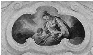
10. melléklet. Portugáliai Szent Erzsébet