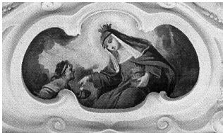
9. melléklet. Árpád-házi Szent Erzsébet