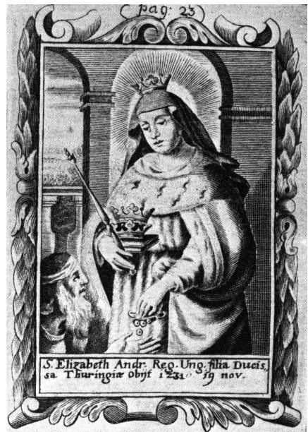
11. melléklet. Schott Hoffman: Árpád-házi Szent Erzsébet, 1689, (Régi Magyar Szentség, metszetek)