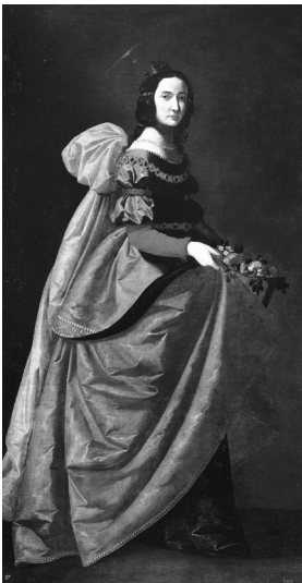
6. melléklet. Francisco de Zurbarán, 1635