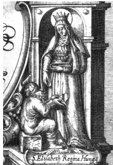
7. melléklet. Pázmány Péter: Isteni igazságra vezérlő kalauz (címlap részlet), 1613