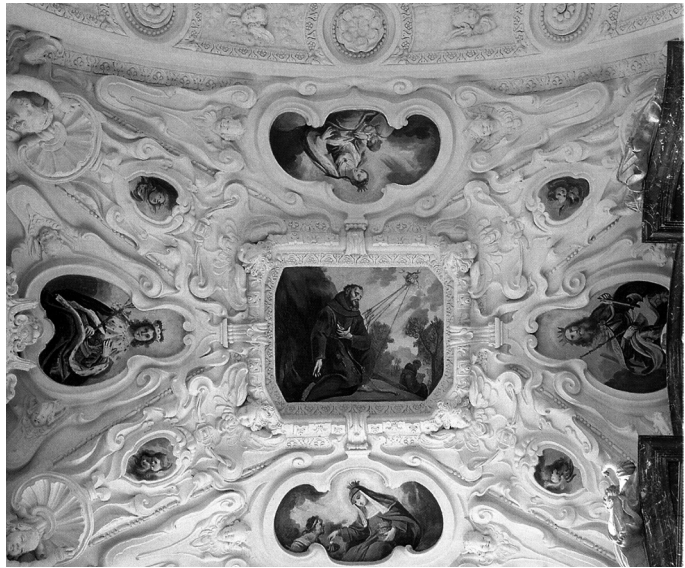
8. melléklet. Szent István kápolna boltozata