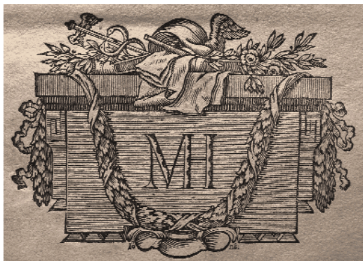
Ifj. Martin Hochmeister fametszetes jelvénye (Szeben–Koloszvár, 1791)

díszes rokokó kiadói jegyekkel szemben ez már a klasszicizmus dekorációs stílusa felé mutat. A kiegyensúlyozott, harmonikus rézmetszet egy kőből készült oltárt ábrázol, rajta egy szimmetrikusan keresztülvetett tölgyfalombokból font füzérrel, amelynek szalagokkal megerősített végei a két szélén lógnak le. Az oltáron babérlombok és rózsák között egy könyvet és papírlapokat, valamint a kereskedelemre utaló szimbólumokat: Hermész (Mercurius) kaduceusát és láthatatlanná tevő szárnyas sapkáját láthatjuk. A jelvény egyik lenyomata szignált: I. G. sc.