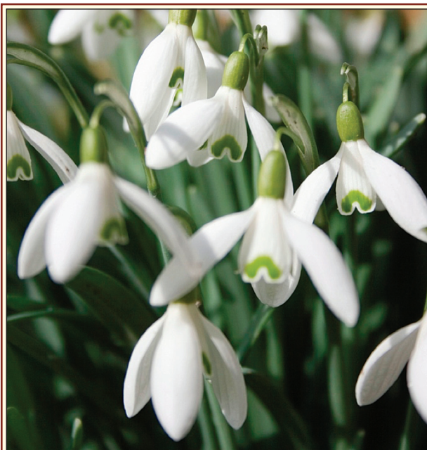
1. ábra: A Galanthus nivalis L. (Fotó: Jardin Botanique Lyon / Foter.com / CC BY-NC-SA)